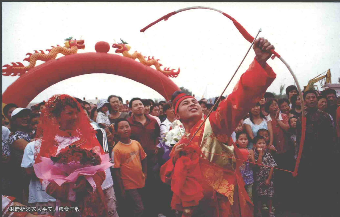
射箭祈求家人平安、粮食丰收

自1644年努尔哈赤率领清军进驻北京成立清朝，到1911年辛亥革命，清朝土崩瓦解，满族统治中国268年，是统治过中国的四个少数民族之一。103年后，满族自己的文字、服饰、生活方式多已消失，东三省的几个满族自治县也仅仅是个符号而已，在这些县城根本看不到身穿满族服饰的人。全国能流利说满语并能翻译满文的人已经非常少了，保护满族传统文化迫在眉睫。