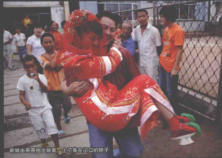
新娘由哥哥抱出娘家，上了等在门口的轿子