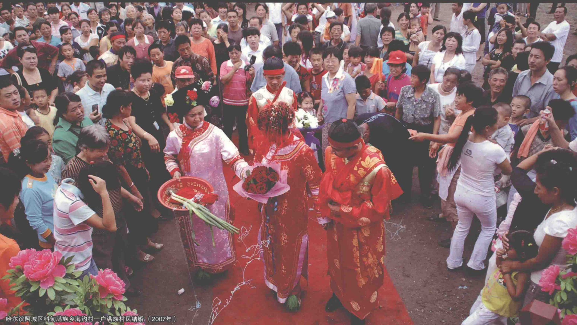
哈尔滨阿城区料甸满族乡海沟村一户满族村民结婚（2007年）