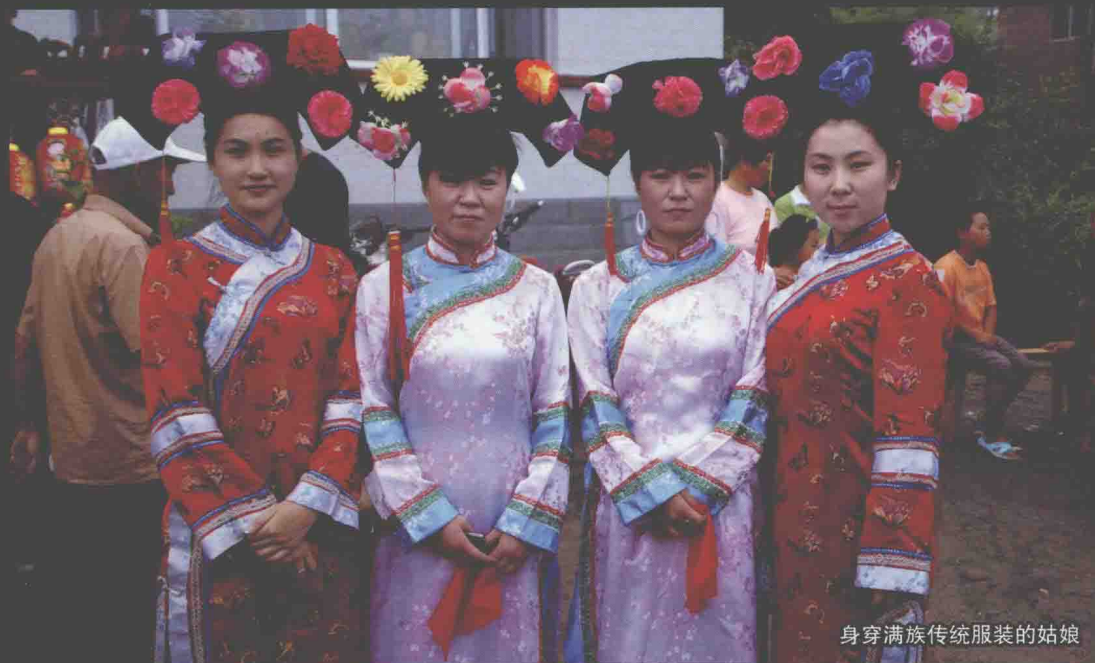
身穿满族传统服装的姑娘