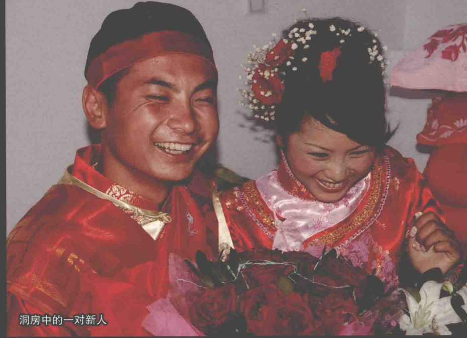
洞房中的一对新人