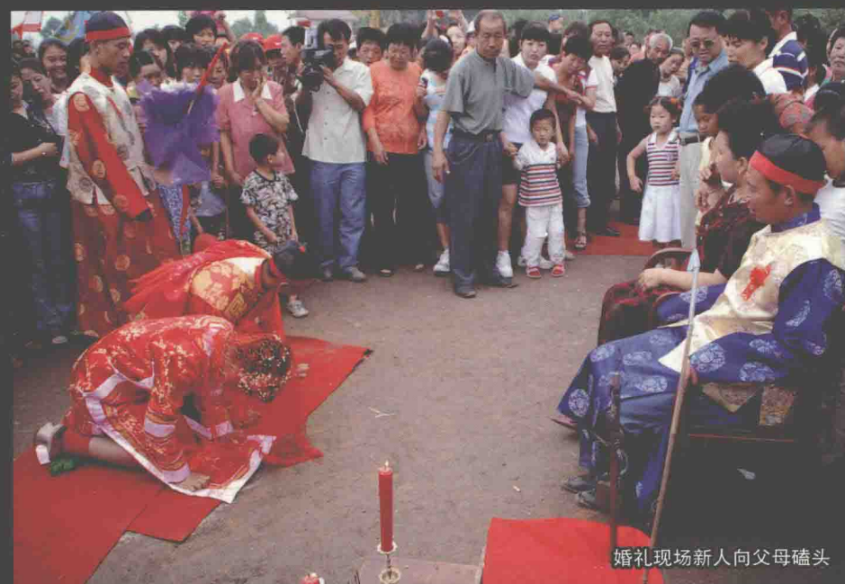
婚礼现场新人向父母磕头