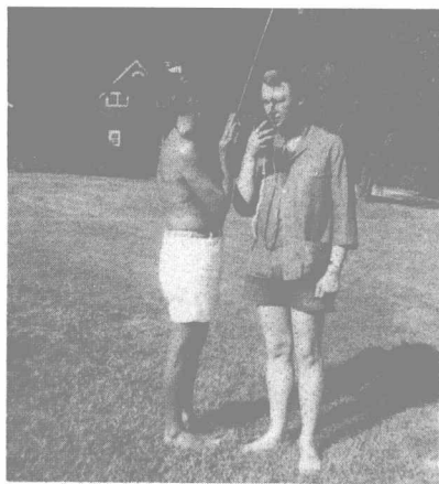
伯恩斯坦和麥克·尼科爾斯玩著亞歷山大的對講機。在照片的背景中可以看到伯恩斯坦在費爾菲爾德的工作室。