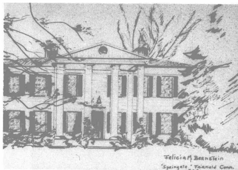
費莉西婭畫的「春之門」，即他們在康乃狄克州費爾菲爾德的住所。它被用作1963年的家庭賀卡。