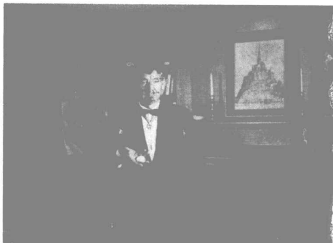
萊奧納德扮演史卡皮亞男爵。

著名的「倫尼跳躍」——1970年在倫敦聖保羅大教堂彩排威爾第的《安魂曲》時所捕捉到的鏡頭。伯恩斯坦的腳離指揮台有一英尺。從左至右為：瑪蒂娜·阿羅約、約瑟芬·韋齊、普拉西多·多明哥和魯傑羅·賴蒙蒂，倫敦交響樂團伴奏。