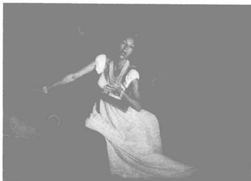
在一部由史蒂芬·桑德海姆導演的伯恩斯坦家庭電影中，費莉西婭扮演芙洛莉亞·托斯卡。