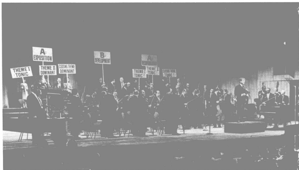
「什麼是奏鳴曲式？」青年音樂會，1964年。1958~72年，伯恩斯坦帶領紐約愛樂，通過電視以音樂會的形式共授課五十三個小時。