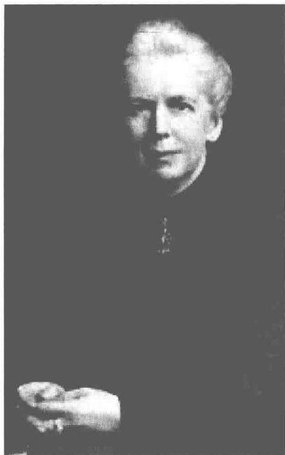
埃莉诺·乔戴恩（1863—1924），英国学者，1915—1924 年任牛津大学圣休斯学院院长。

·最后，莫伯利女士通过一座同时代的玛丽·安托瓦内特的雕像辨认出了那个坐在小特里亚依宫前的草地上的女人就是王后本人。