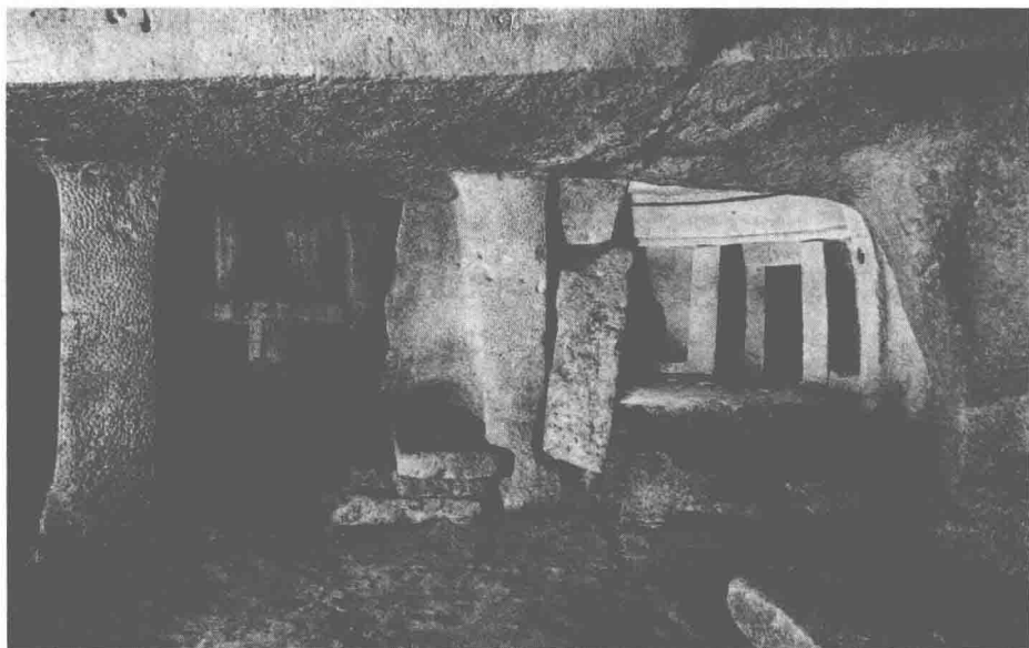
哈尔萨夫列尼地宫（1）。

1902 年建造的房子的入口位于底层，入口下的 3 层通向地下 13 米深处。天然岩石雕刻出层层叠叠的密室，构成了一个系统。这个系统包括入口和通