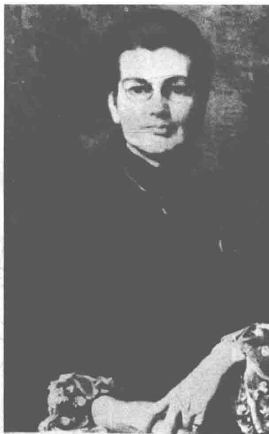
安妮·莫伯利（1846—1937），英国学者，牛津大学圣休斯学院首任院长。

1904年，她们再次去了凡尔赛宫。这一次她们发现，这所小房子与之前看到的完全不同，上次在房子前有一个手里拿着水壶的女人和一个女孩。而且，上次遇到两个戴三角帽的男人的地方似乎也完全不同了。那个穿有搭扣的鞋的陌生人指给她们的小路根本就不存在。一切都一样了：没有木桥和溪谷小路，