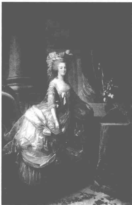
玛丽·安托瓦内特（1755—1793）， 法国国王路易十六的妻子，法国王后。