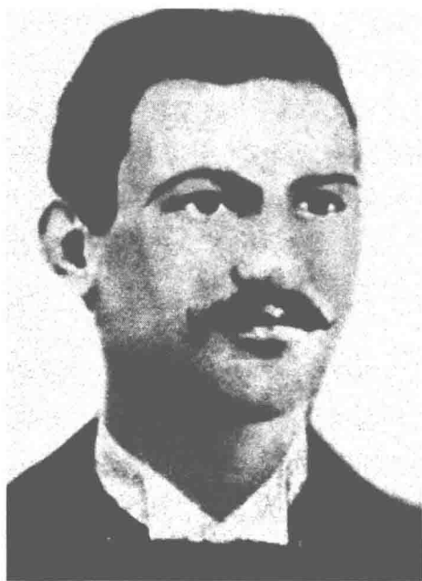
盖塔诺·布雷西，刺杀翁贝托一世的无政府主义者。