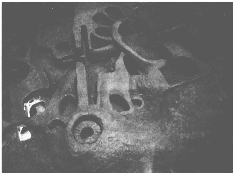
哈尔萨夫列尼地宫全貌模型。

米深的地下层发现了大量人类骨骼。“马耳他考古之父”迪米斯托克利·扎米特博士估计骨骼的数量多达 8 000 块。这个地宫的用途是什么？它有什么禁忌吗？毕竟马耳他人都因为害怕而避开这个可怕的地方。