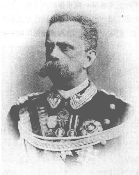
翁贝托一世（1844—1900），萨伏依公爵和意大利国王。

1900年7月28日，国王翁贝托一世和他的副官在意大利北部城市蒙扎的一个饭店进餐。他第二天将出席在那儿举办的一场体育比赛。他惊讶地发现，这个饭店的店主看起来与自己非常相