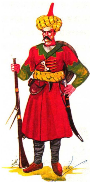
◎ 托方赤步兵，装备火枪、弯刀、匕首

竖在地面上的 10 根长枪上放置的苹果，每一个苹果都能被托方赤从 100 步距离上精准地击中。