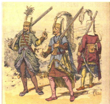
⊙ 以火枪为首要武器的奥斯曼帝国耶尼沙里步兵

纳迪尔沙的军队，继承了萨法维王朝军队的一些特点，也有自己的创新。与之前的伊朗军队一样，他的军中有大量轻装骑兵，从游牧民中招募，尤其以土库曼人最为重要。伊朗骑兵很传统，装备轻链甲，使用长矛、马刀，也有钉头锤(mace)、弓箭等武器，靠冲锋和肉搏制胜，能够在战时根据各自需要迅速散开或集合。