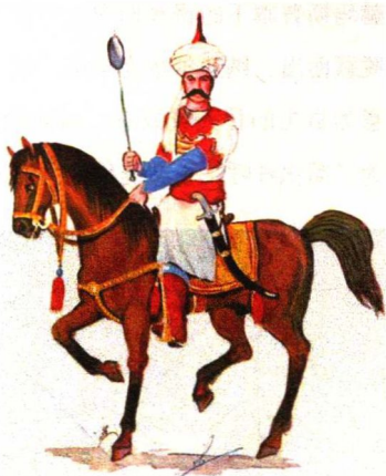
◎ 红头军军官，手持钉头锤 (mace)，腰挎弯刀

易司马仪时代的波斯军队，中坚是突厥红头军，几乎全部是使用冷兵器的轻骑兵，无论是作战、行军还是执行日常仪仗任务，红头军都按部落的序列编组和展开，哪个部落的红头军在沙 (shāh) 的左翼，哪个在右翼，都雷打不动。沙 (即国王) 从红头军各部中选拔佼佼者，组成禁卫军，以蒙古统治时期的箭筒士 (qūrčī) 命名，按《元史》卷 99《兵志二宿卫四·怯薛》的译法，叫“火儿赤”，沙和火儿赤禁军永远在阵线中央，部落红头军在左右两翼。红头军是军队，也是部落组织，既是王朝的根基，却又保留了很多部落传统，是沙实行集权统治的障碍。鉴于红头军骑兵在奥斯曼军队的火炮面前吃了大亏，后世沙们增加了火枪步兵比例，并组建了炮兵，波斯军队缓慢但逐步近代化。