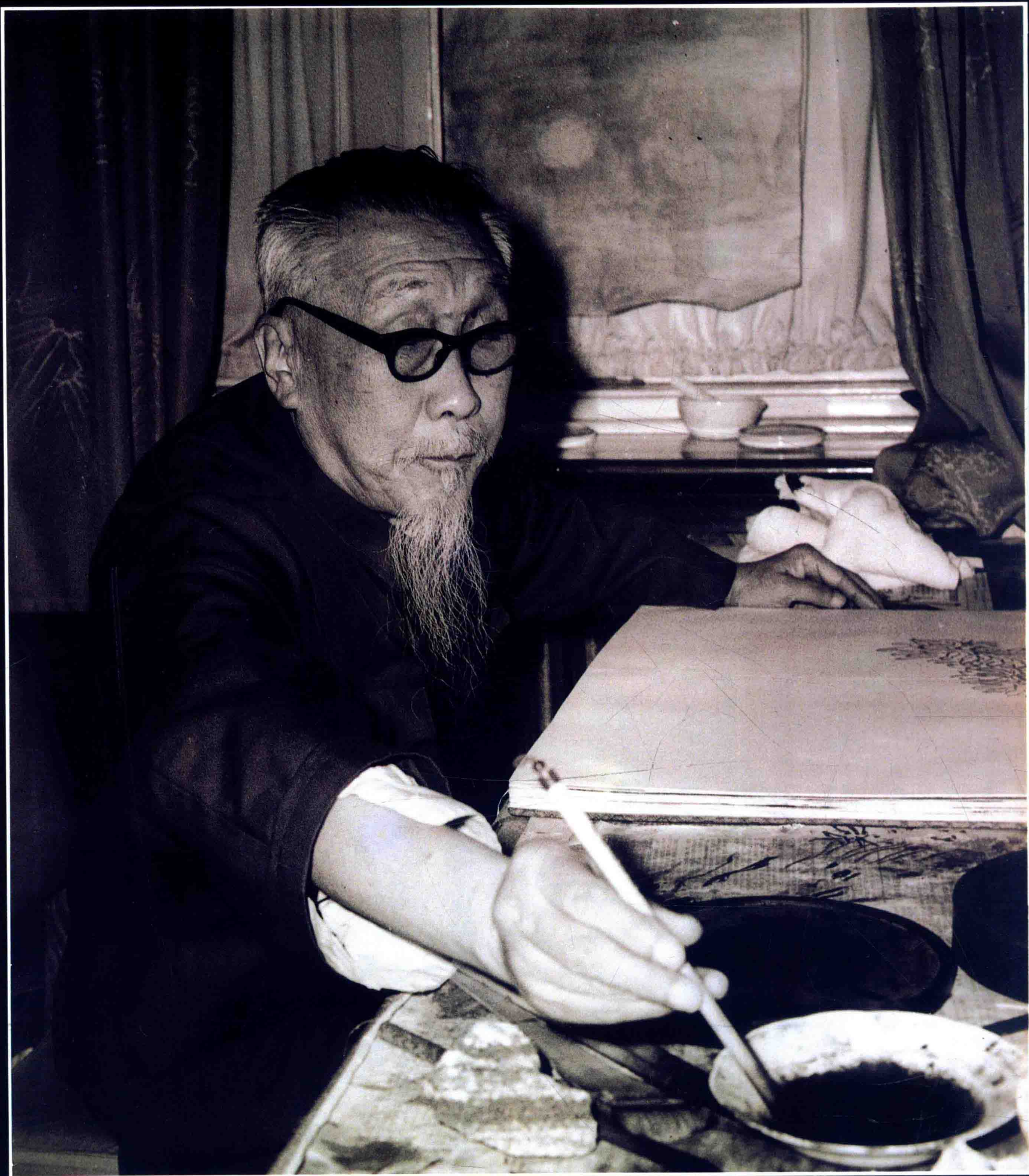
錢松岩先生(1899—1985) Mr Qian Songyan at work