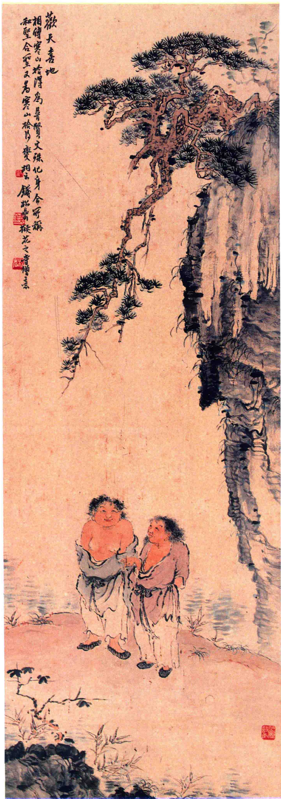
歡天喜地 (101×34cm) To the satisfaction of all