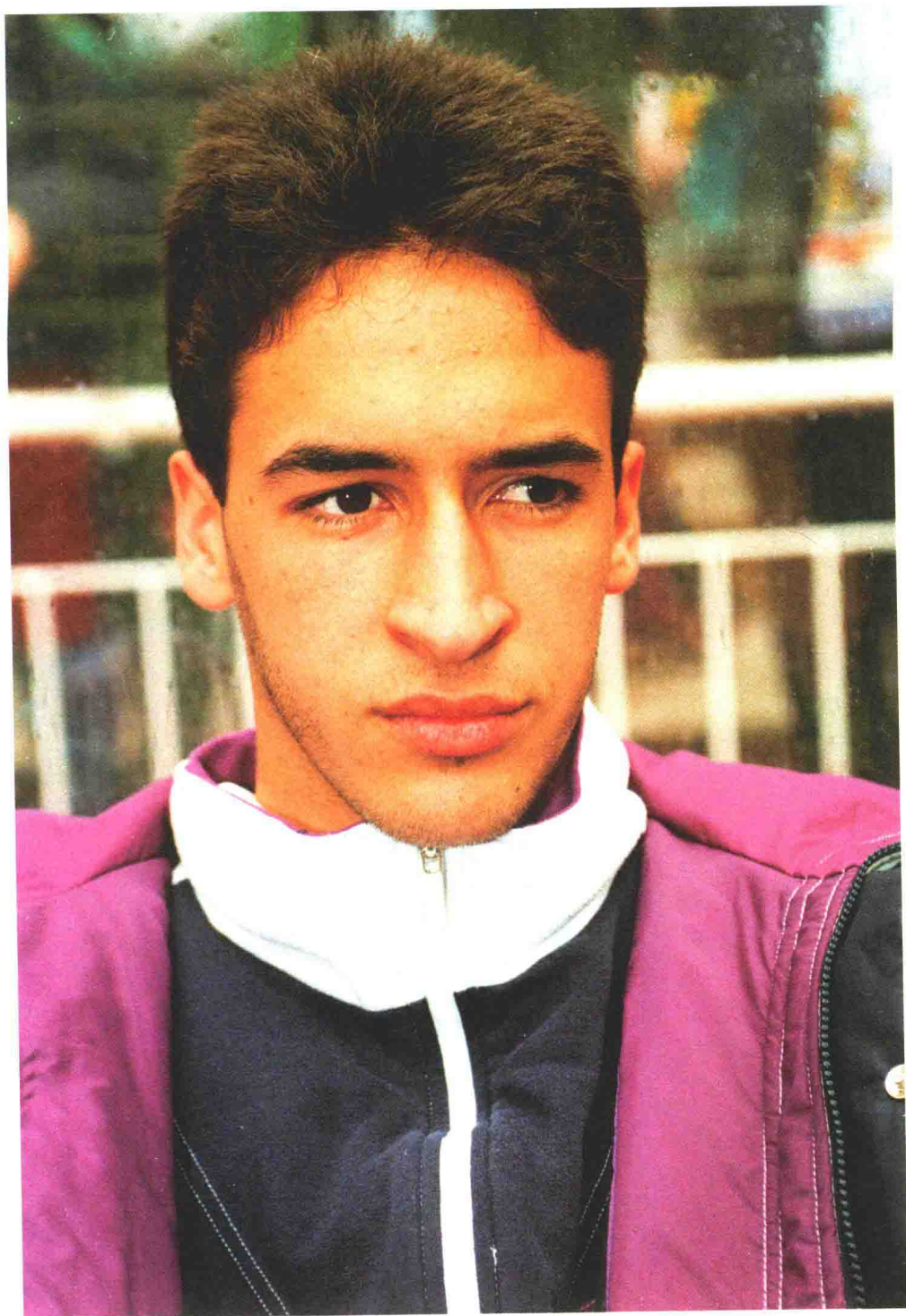
劳尔从小就比其他的同龄孩子瘦弱，看上去甚至有些营养不良。