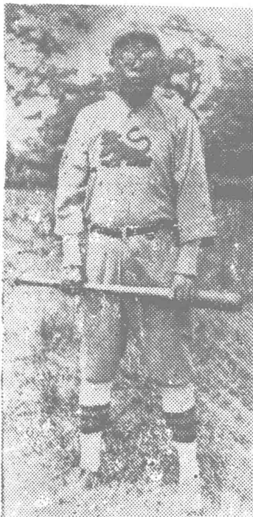
梁扶初摄于1922年，日本横滨市