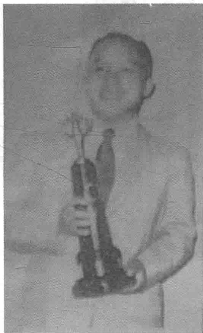
于1954年（香港）