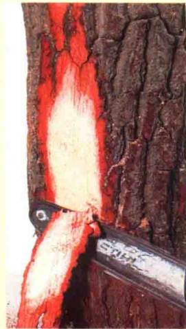
学习如何使用木头

本书将介绍雕塑艺术的基本技巧，展示如何使用基本材料。通过对本书的学习，你将了解到如何创作美丽的雕塑作品。雕塑的制作是一个需要时间、精力和耐心的过程。你需要很长的时间来熟悉和掌握你选择的材料的性能。你应在正式创作雕塑作品之前练习或模拟几次。如果之前有充分准备创作起来就能有条不紊，通过不断练习雕刻，并且持之以恒，那么最终一定会收获成功、满足和愉悦。