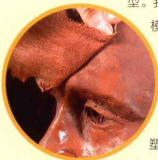
肖像雕刻技巧创新

20世纪，橡胶、玻璃纤维、树脂和塑料的使用为雕塑艺术开发出了各种新的可能。从金属焊接艺术，到各种现成物品或者不同材料混合物的组合雕塑，现代雕塑涉及广泛的技巧和材料。