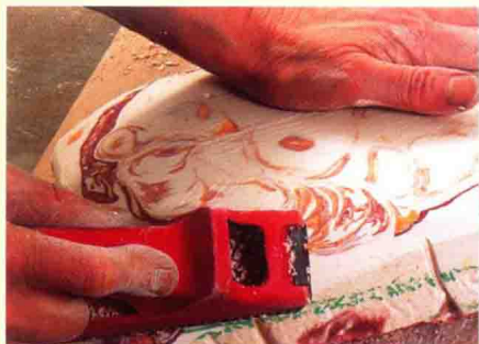
掌握一系列的工具和材料