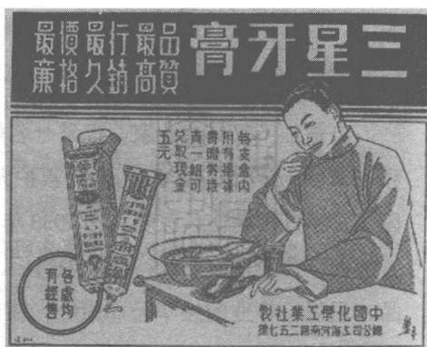
1923年，中国第一代牙膏——三星牌牙膏问世，立即畅销国内，并远销东南亚和非洲。

花膏、生发油、牙粉等产品。因无力刊登广告，他只好雇人挑担售货，结果不到3年，血本全亏，但他并不气馁。舅父李云书资助他5万元，在广东路设立发行所，增加果子露、皮鞋油等产品，但营业仍然毫无起色，年年亏损。