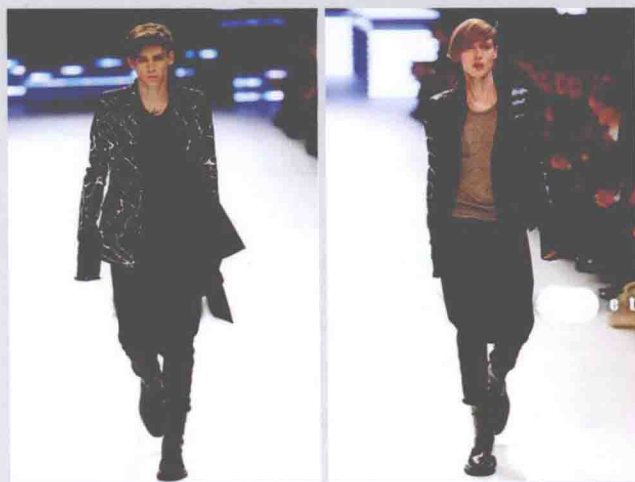
►图1-4 优化缠绕型裤子——落裆裤

用布在身上缠绕时，可以不管体型，只根据自己的喜好来决定放松量。若松松地缠，则易于通风，几乎可以自由地呼吸空气；若重叠数层紧紧地缠，则易于保温。当从身上脱下这衣服时，又可以简单地把布折叠起来进行保管，十分方便。这些未被加工过的布，经过各种缠绕方法，蕴藏着创造各种服装造型的可能性。由此可见，缠绕式穿衣是人类穿衣的原点。