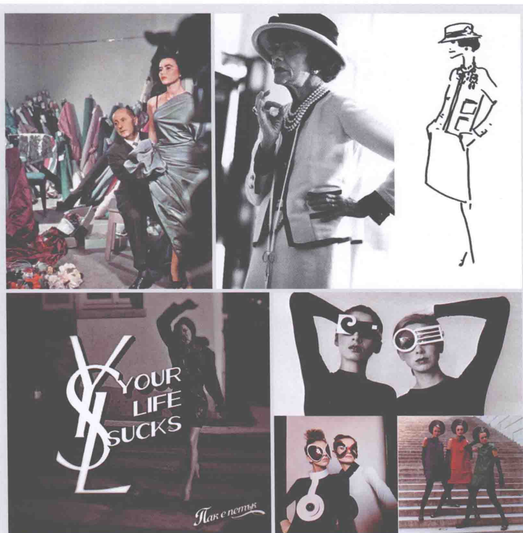
▶图0-1 Dior、Chanel、Ysl、Pierre Cardin设计大师作品

何为经典服装设计作品？所谓经典，是指传统而具有权威性的设计作品。服装自问世以来，受到时代审美与社会变迁的影响，一直处于变化之中，而经典服装设计作品就是随着时间的流逝，具有服装设计里程碑意义的作品。纵观服装发展历程，经典服装设计作品虽呈现出千姿百态的外观特征，但从服装设计本身而言，它们却具有某些审美和判断的共性，这类共性就是经典的衡量标准要素，只有了解这些要素才能架构起与设计师的对话平台，才能对服装设计作品进行深度解读，鉴赏出经典服装设计作品的精妙之处。图0-1为Dior、Chanel、Ysl、Pierre Cardin设计大师的作品。