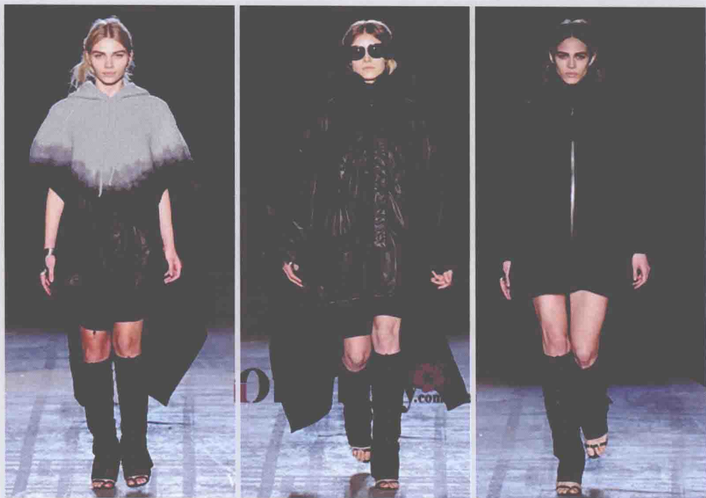
►图1-2 贯头型服装的连肩设计

一般在袖下缝合，留出袖口，钻头的开口有的是两块布缝合时留出来的，开口处采用拉链作为闭合设计。