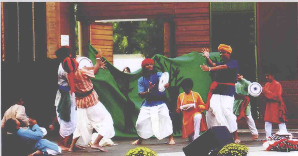
►图1-3 传统缠绕型裤子——多蒂

用布在身上缠绕时，可以不管体型，只根据自己的喜好来决定放松量。若松松地缠，则易于通风，几乎可以自由地呼吸空气；若重叠数层紧紧地缠，则易于保温。当从身上脱下这衣服时，又可以简单地把布折叠起来进行保管，十分方便。这些未被加工过的布，经过各种缠绕方法，蕴藏着创造各种服装造型的可能性。由此可见，缠绕式穿衣是人类穿衣的原点。