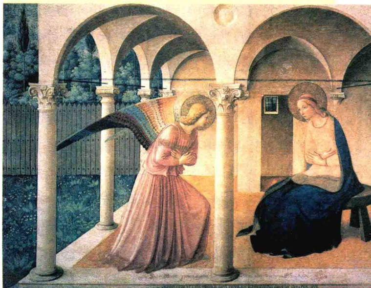
《天使报喜》，安吉利科作，1440年。意大利佛罗伦萨圣马可博物馆壁画。