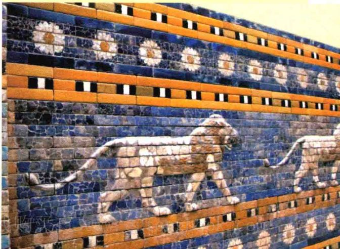
古巴比伦狮形彩釉砖浮雕，藏于德国柏林佩加蒙博物馆。

古埃及的画都在陵墓里，从一开始就不是用来给谁看的，而在两河流域，人们并不关心死去的人，他们的画是给活人看的。住在两河流域的国王们都不热衷修建陵墓，对自己死后