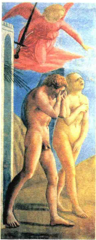
《逐出伊甸园》，马萨乔作，1424—1427年。藏于意大利佛罗伦萨卡敏圣母堂布兰卡奇礼拜堂。