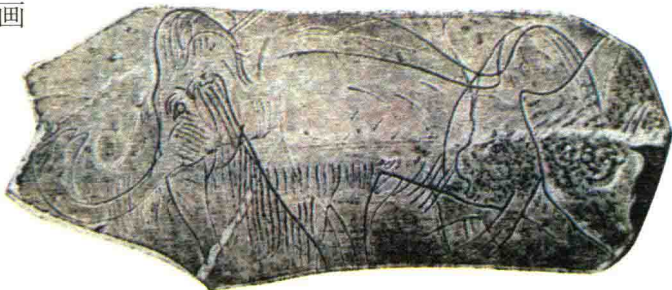
法国马格德林史前洞穴发现的猛犸象牙上的猛犸刻绘图。

那么，原始人都画些什么呢？事实上，他们描绘的内容很单调，只有一种东西，那就是动物。你可能以为