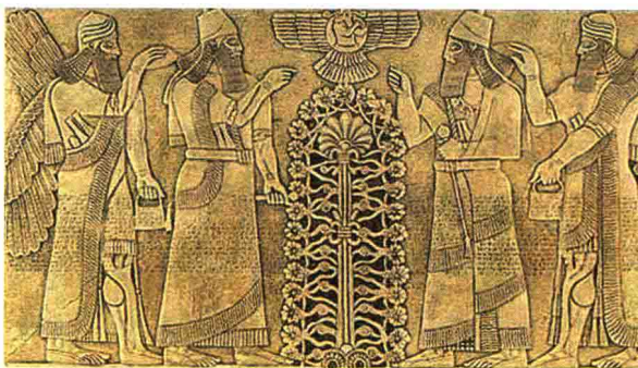
两河流域出土的刻有生命之树图案和头发、胡子呈螺旋卷状的强壮男人的石碑（复原图）。公元前3500年。藏于英国伦敦大英博物馆。

和边框装饰。比如一种叫做圆花饰的图案，中间是一个圆点，周围环绕很多花纹，直到现在还很受欢迎；再比如一种叫做连接环的图案，如今还使用在浴室的地板砖，或公共建筑的砖墙上；又如一种叫“生命之树”的图案，依然被许多国家的人模仿，常用在地毯和刺绣上。