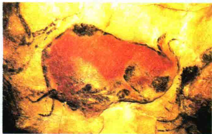
西班牙阿尔塔米拉山洞里的《受伤的野牛》。

最近，人们又在西班牙的埃尔—卡斯蒂略洞发现了一些手模和盘状图案。令人惊奇的是，这些图案居然是将颜料吹到墙上形成的，它们的年代至少可以追溯到 4.08 万年前。