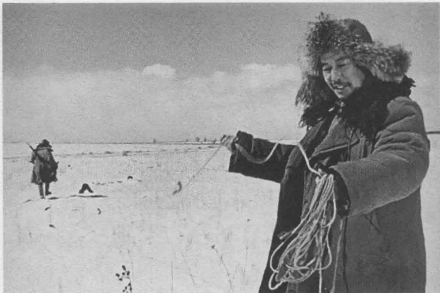
19 老战按照“农场房屋建设图”的设计，开始进行测量工作。他和小冬子踏着深深的积雪，奋力跑来跑去。茫茫的北大荒，第一次留下国营农场建设者的足迹。