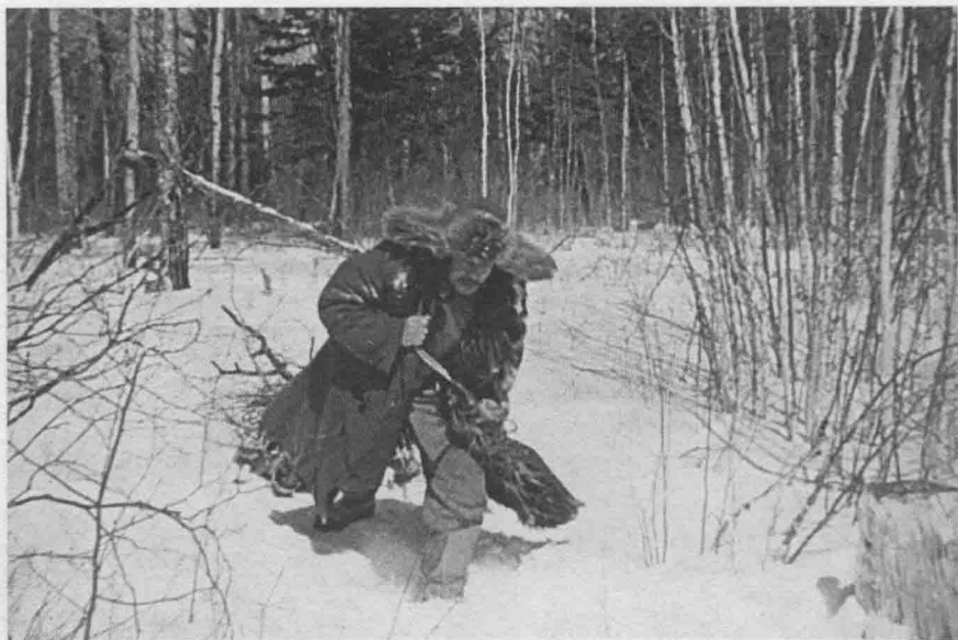
20 老战浑身是劲，一刻不停地工作着。丈量完土地，又去打柴。他拖着一大捆木柴，在没膝的积雪中一步一步地前进。