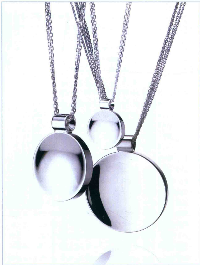
将包豪斯设计理念运用于首饰设计