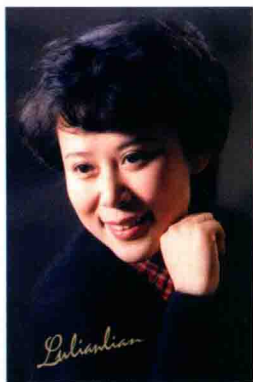
陆莲莲 中国工艺美术大师 高级工艺美术师