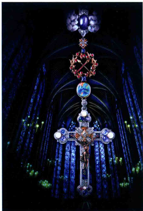
文艺复兴时期风格的珠宝设计