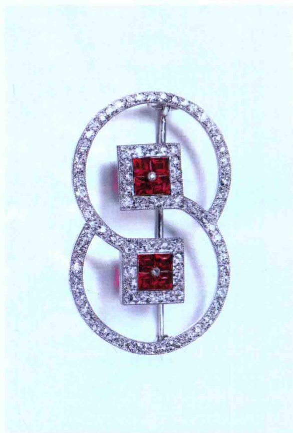
工业革命时期风格的珠宝设计