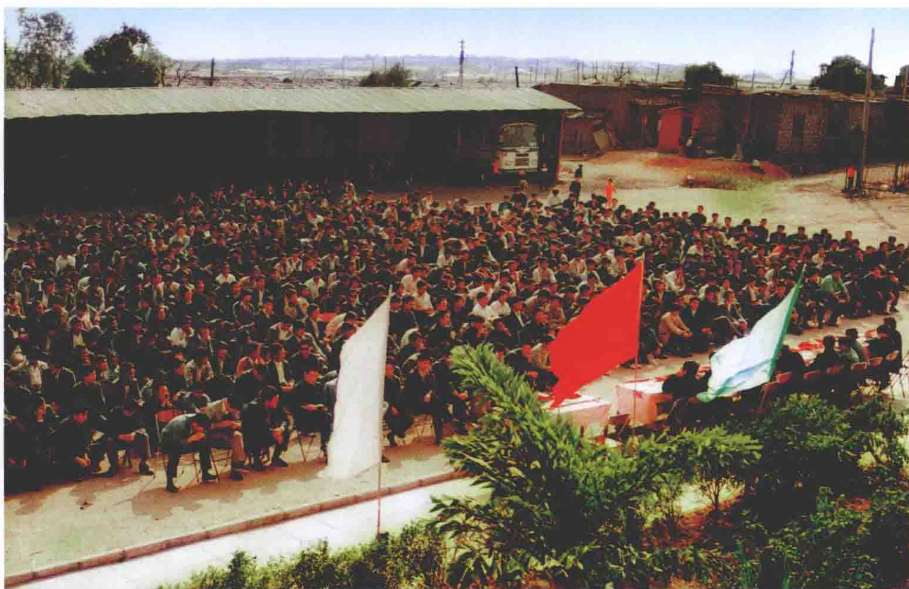
原基建工程兵19团后第三建筑工程公司在营区召开大会，动员干部战士勇当“特区拓荒牛”，为建设深圳贡献青春力量。