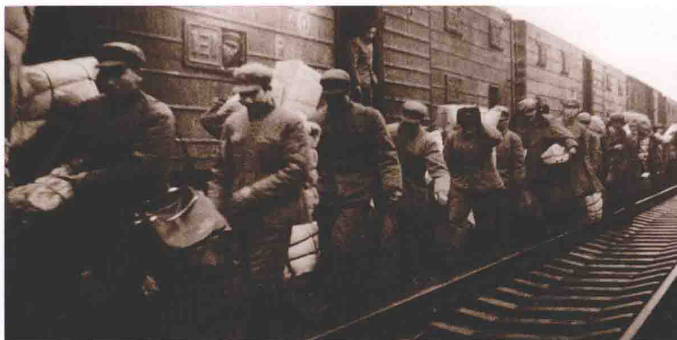
1982年。2万基建工程兵奉命赴深圳，参加经济特区建设。