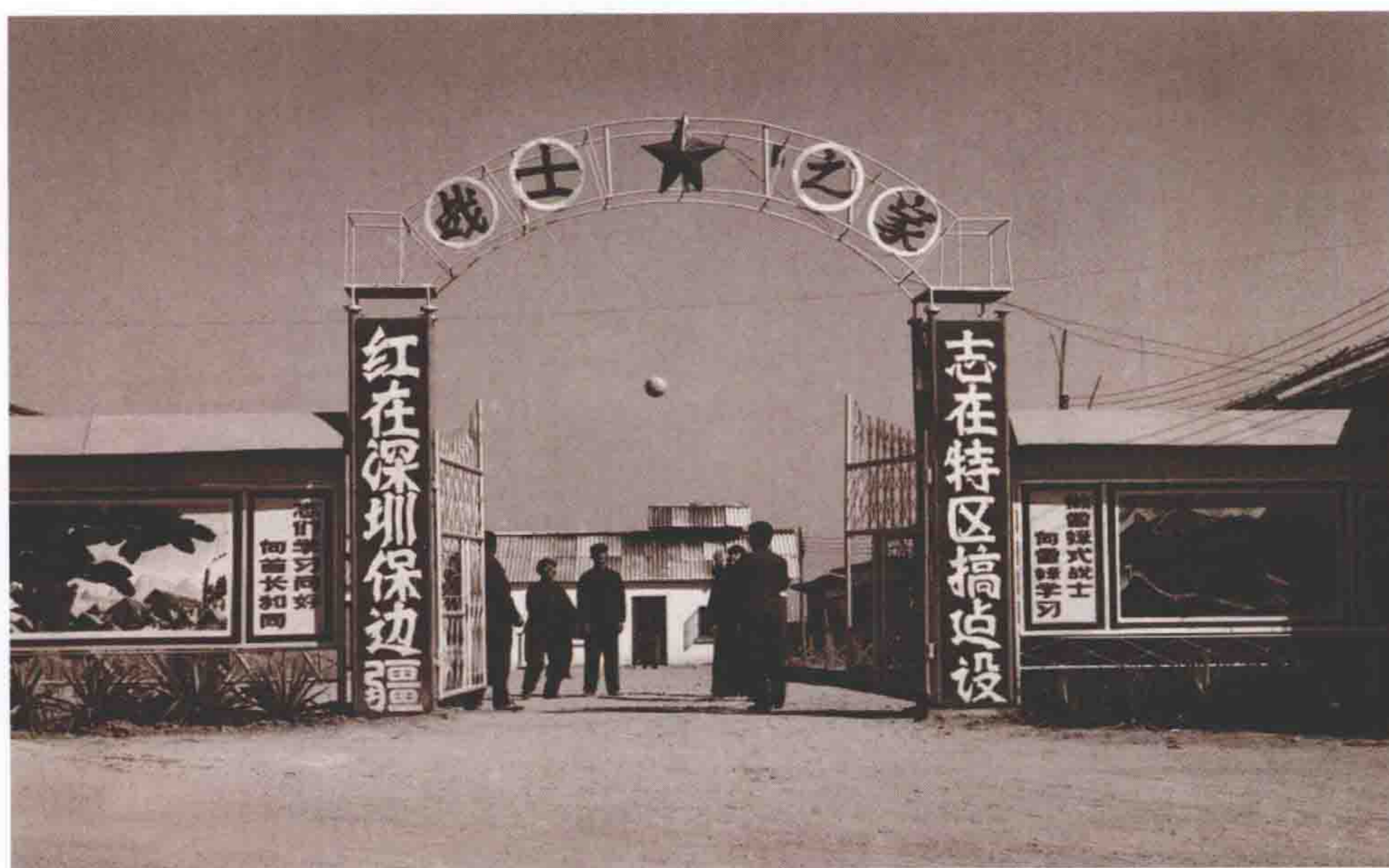
1982年。首批来到深圳的基建工程兵部队在白沙岭一带安营扎寨。