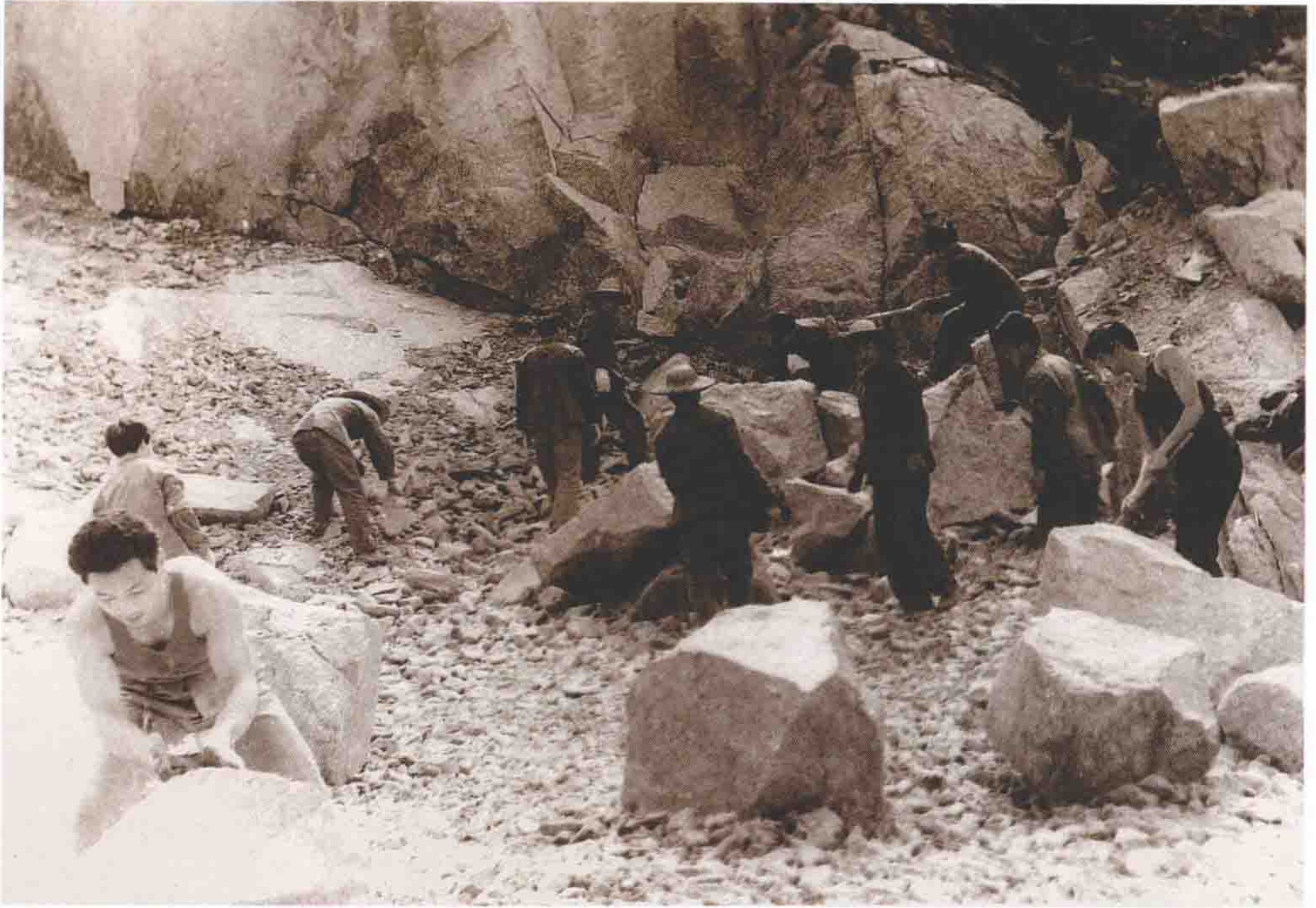
开山劈石。