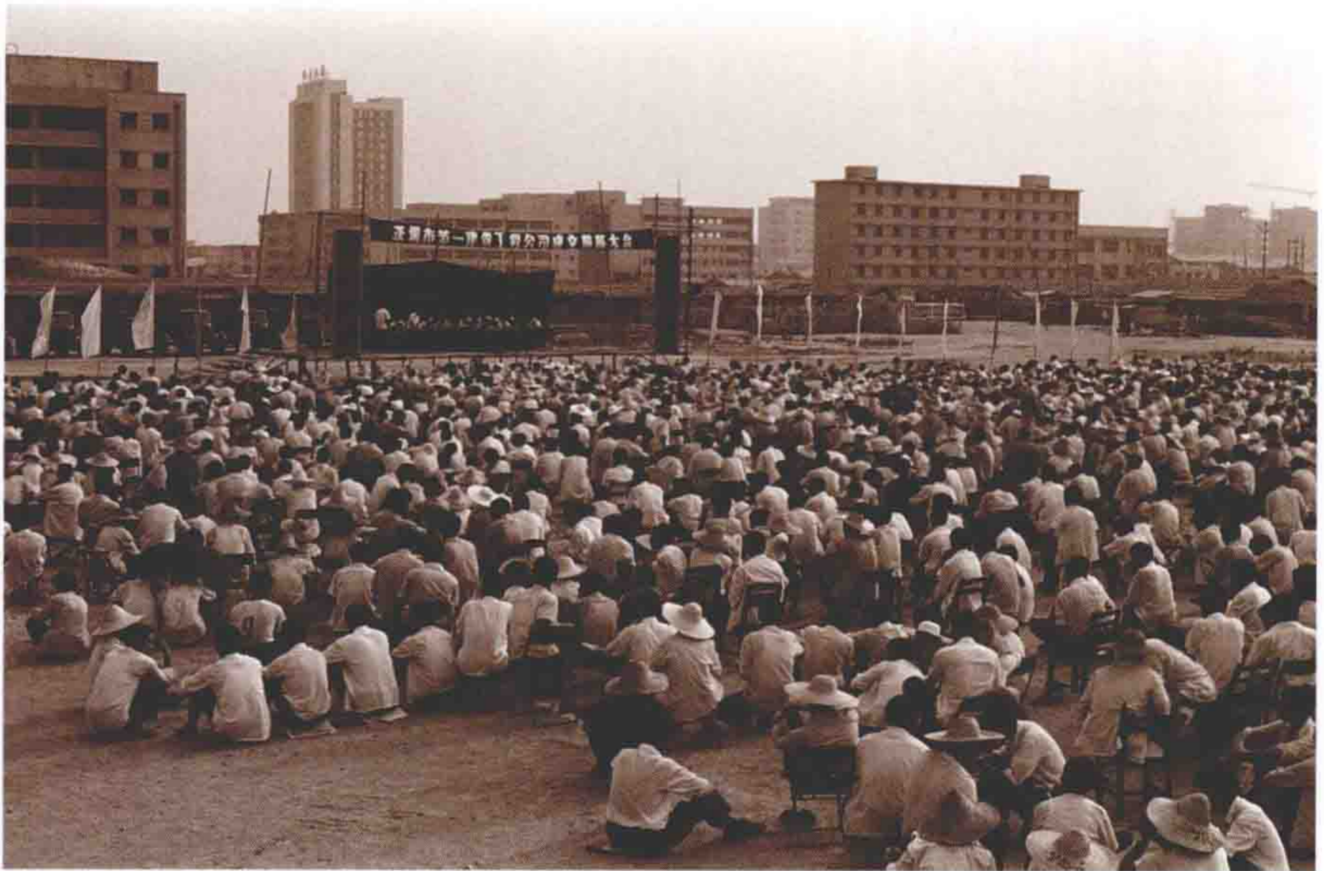
1983年9月。基建工程兵1团改编为第一建筑工程公司，召开成立誓师大会。