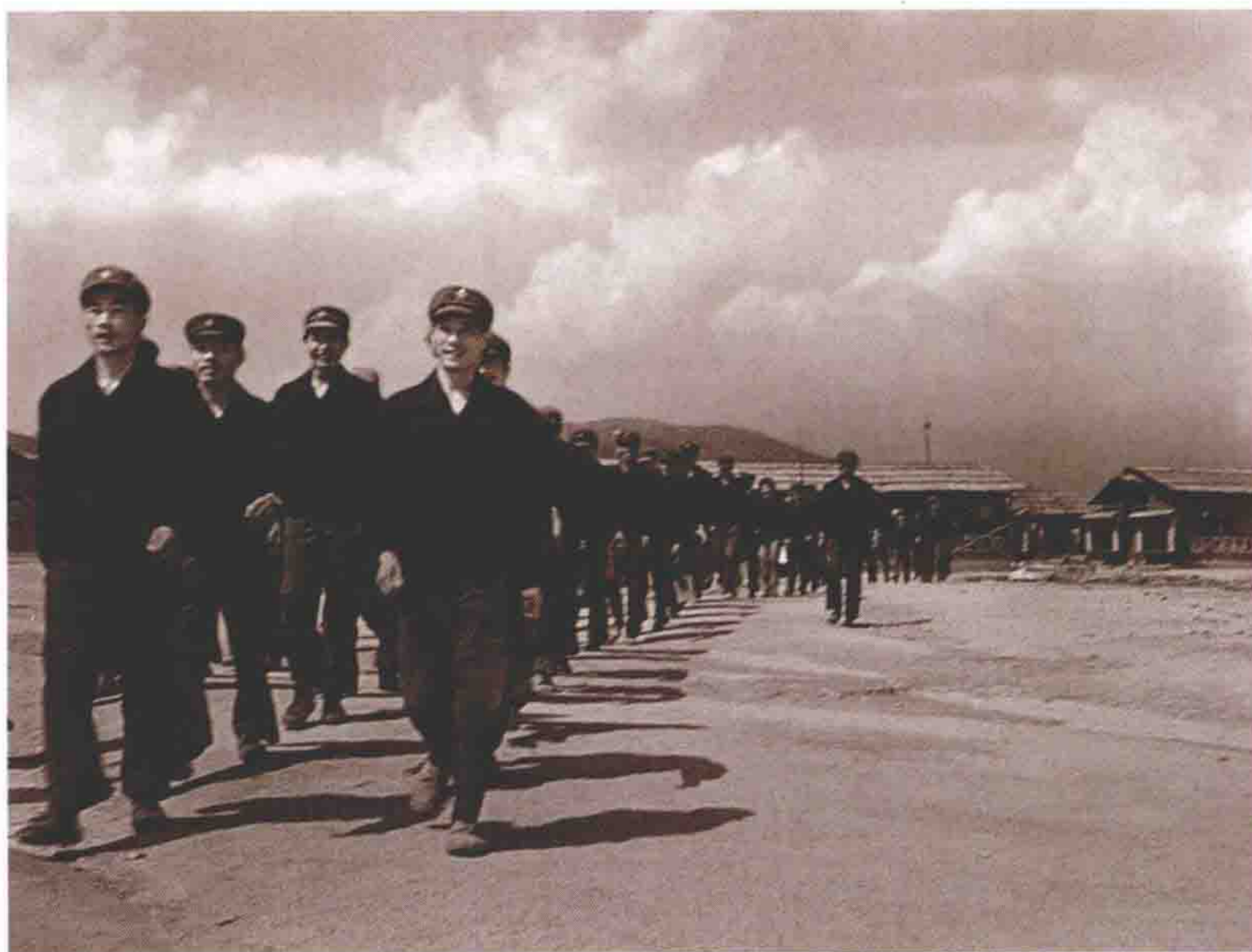
1982年。战士们戴军帽，穿工服，列队走向工地。