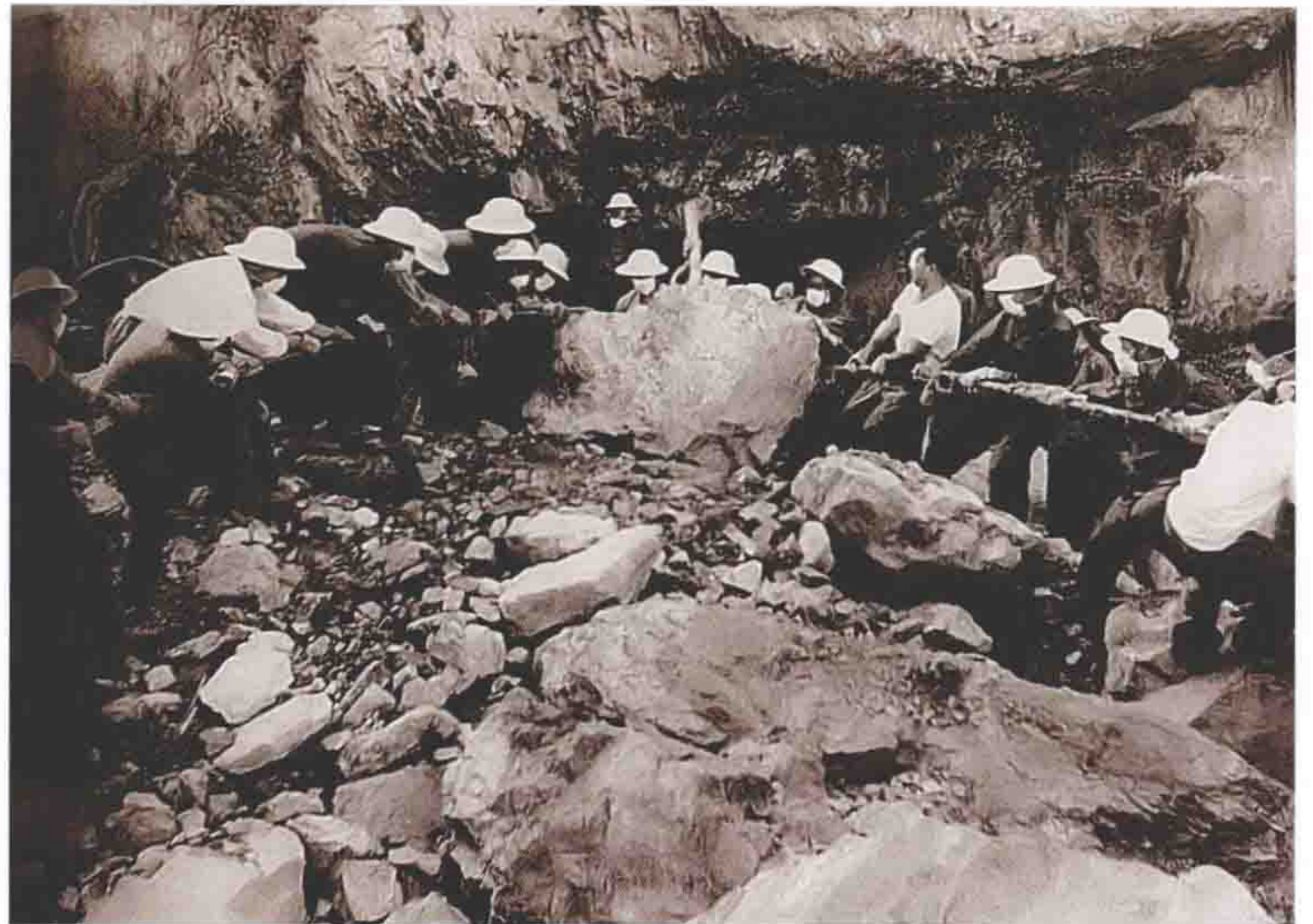
挖山开路。原302团（后市市政工程公司）的施工场面。