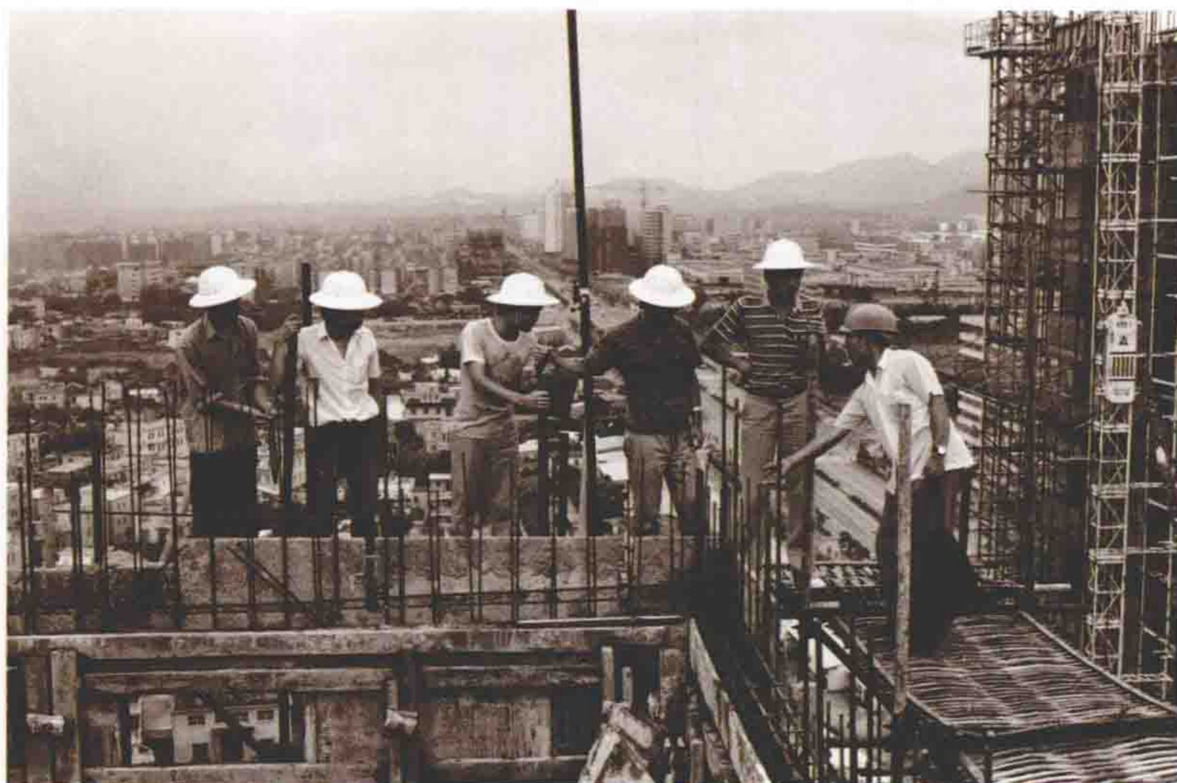
1981年。部队干部到施工现场检查质量安全工作。