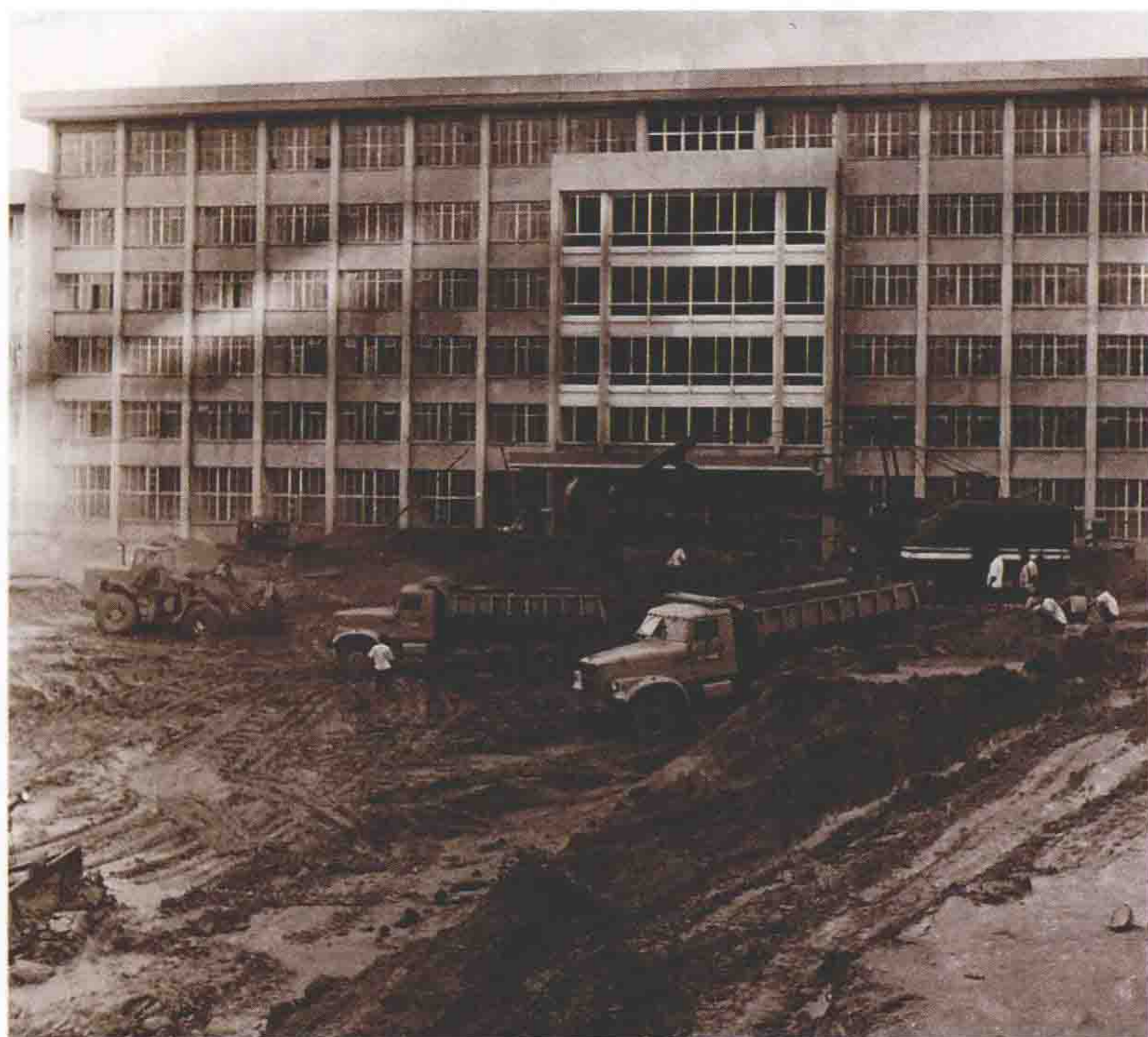
深圳市委大楼施工现场。该工程1980年动工，1981年7月完工。