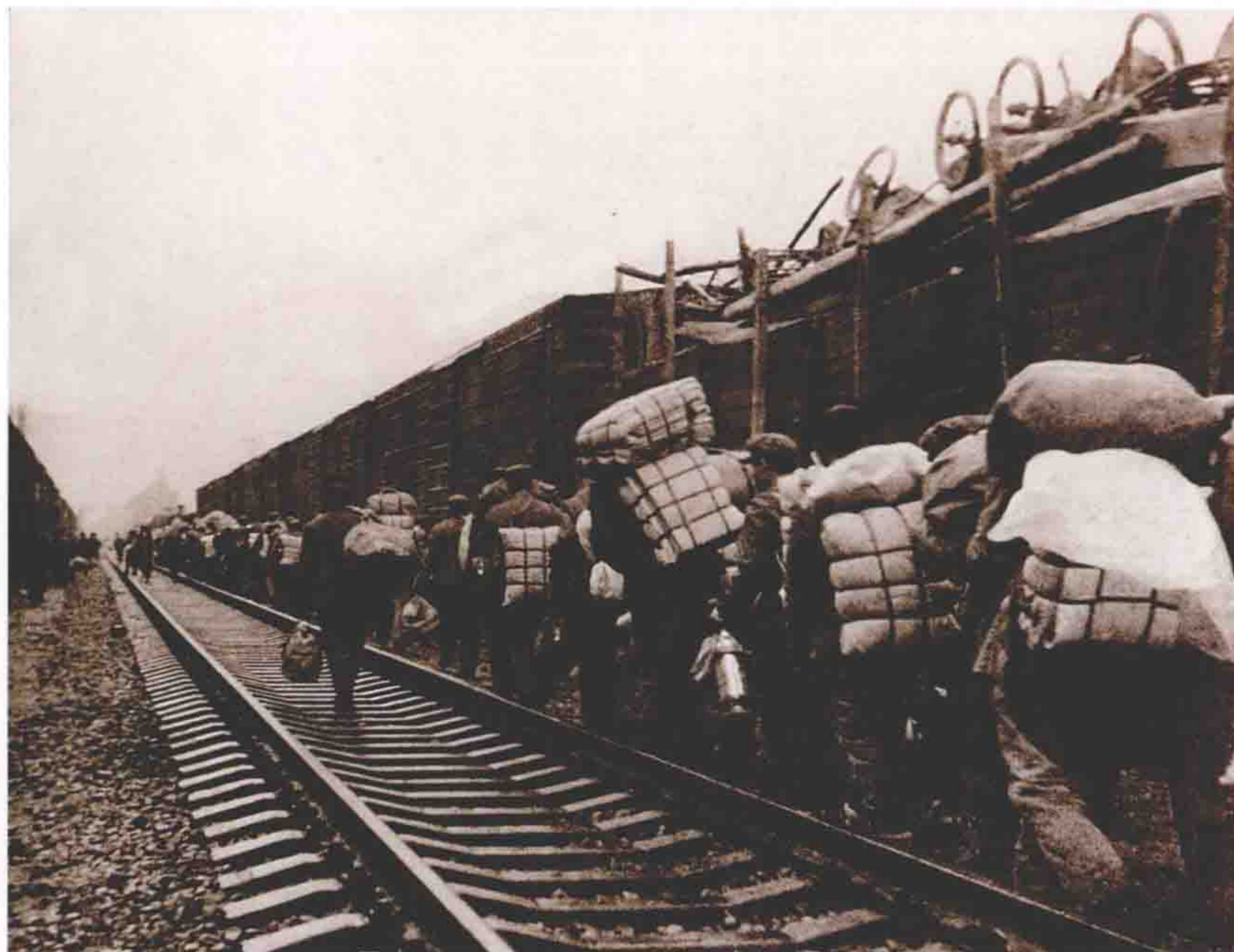
1981年。深圳火车站。基建工程兵首批部队挥师南下，参加深圳经济特区开发建设。