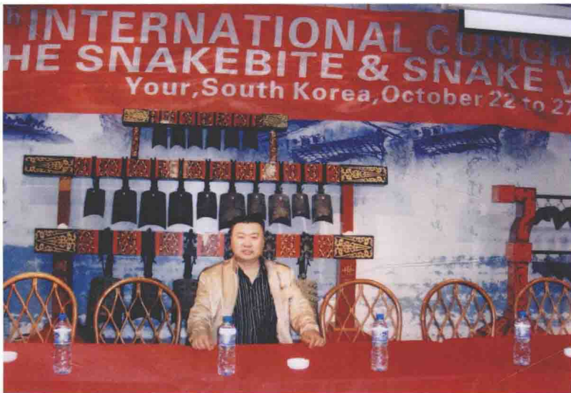
2012年4月在韩国首尔医科大学参加中韩两国蛇伤研讨会