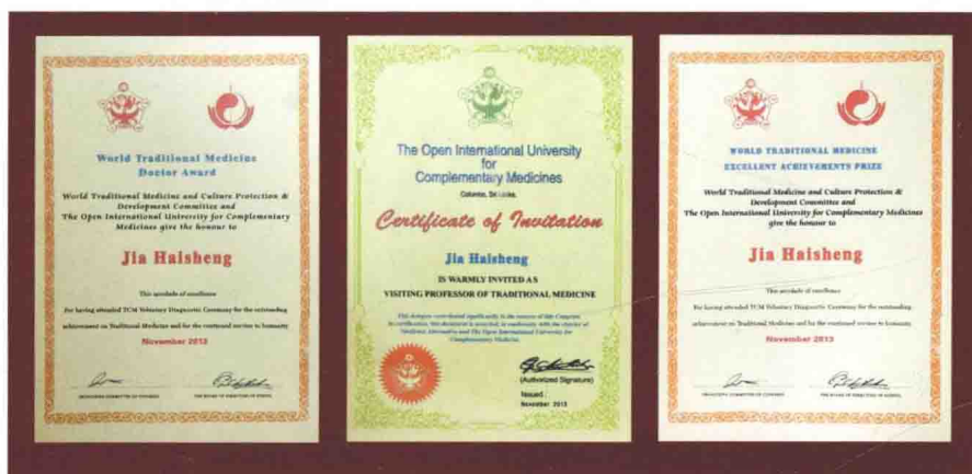
2013年11月,在斯里兰卡国际交流医科大学荣获世界传统名医奖证书以及国际交流医科大学客座教授证书