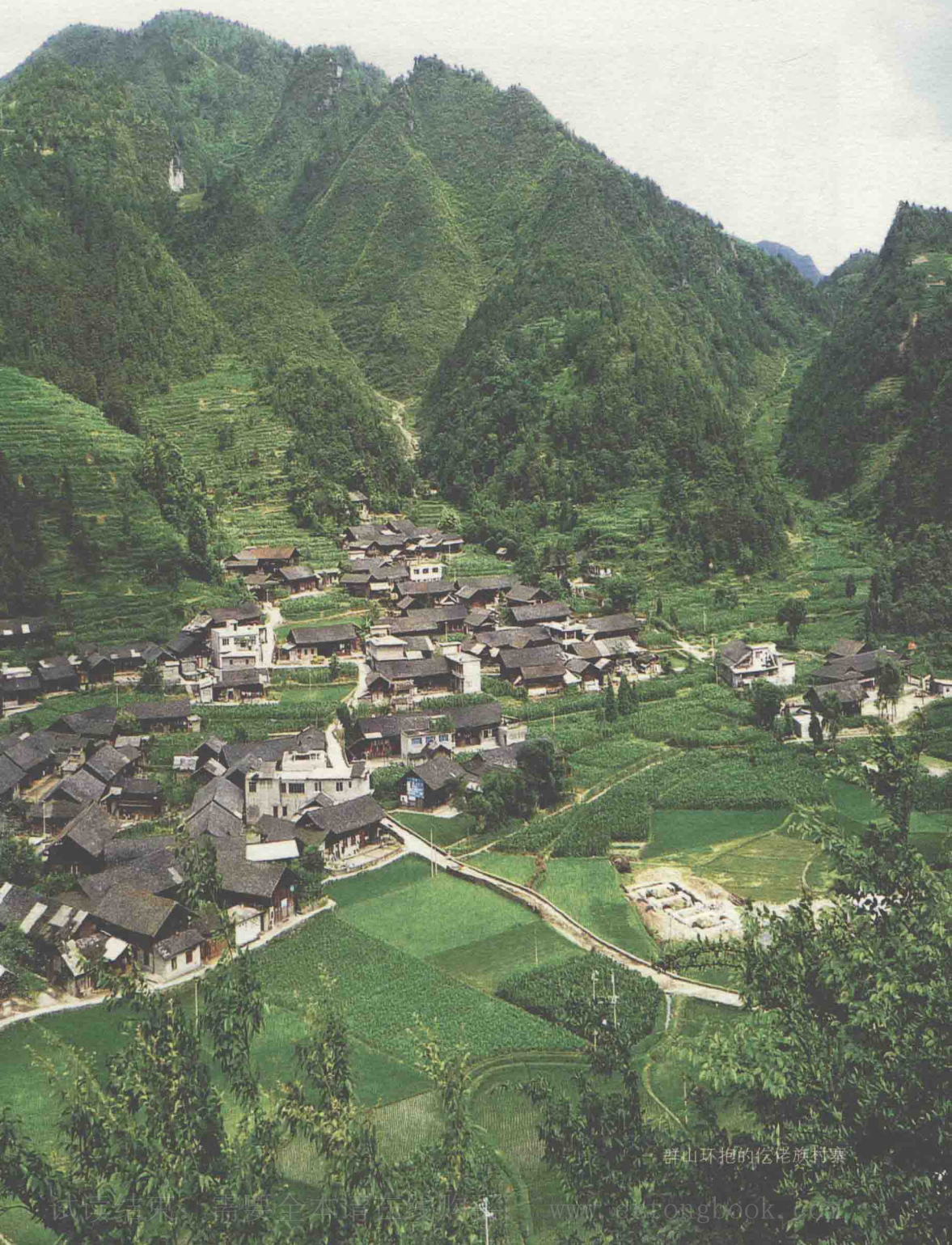
群山环抱的侗族村寨