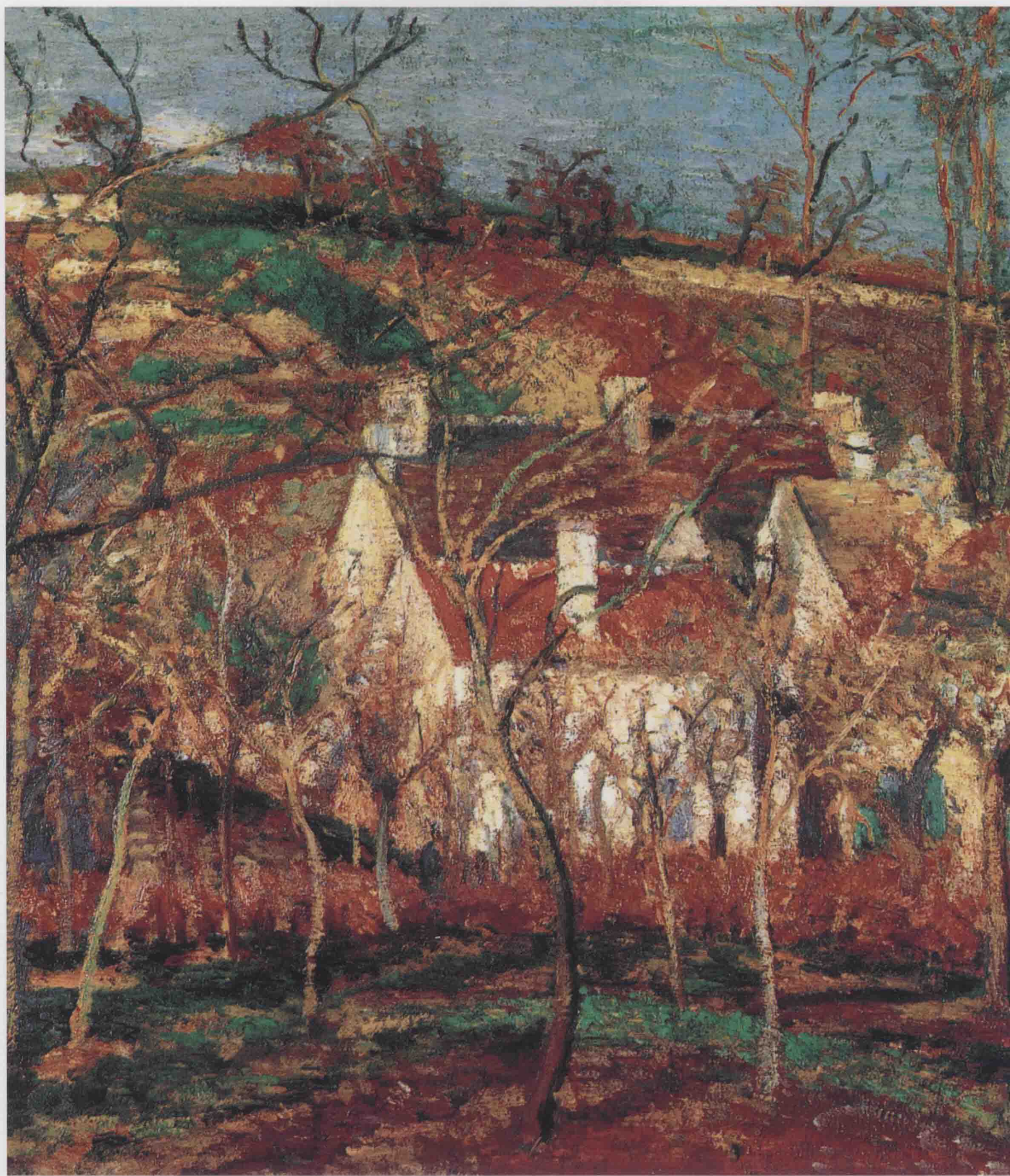
冬天村子里有红色屋顶的房子 1877年 54.5cm x 65.6cm