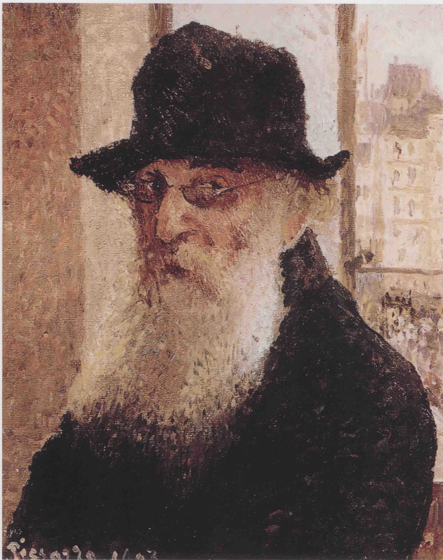
自画像 1903年 41cm × 33.3cm