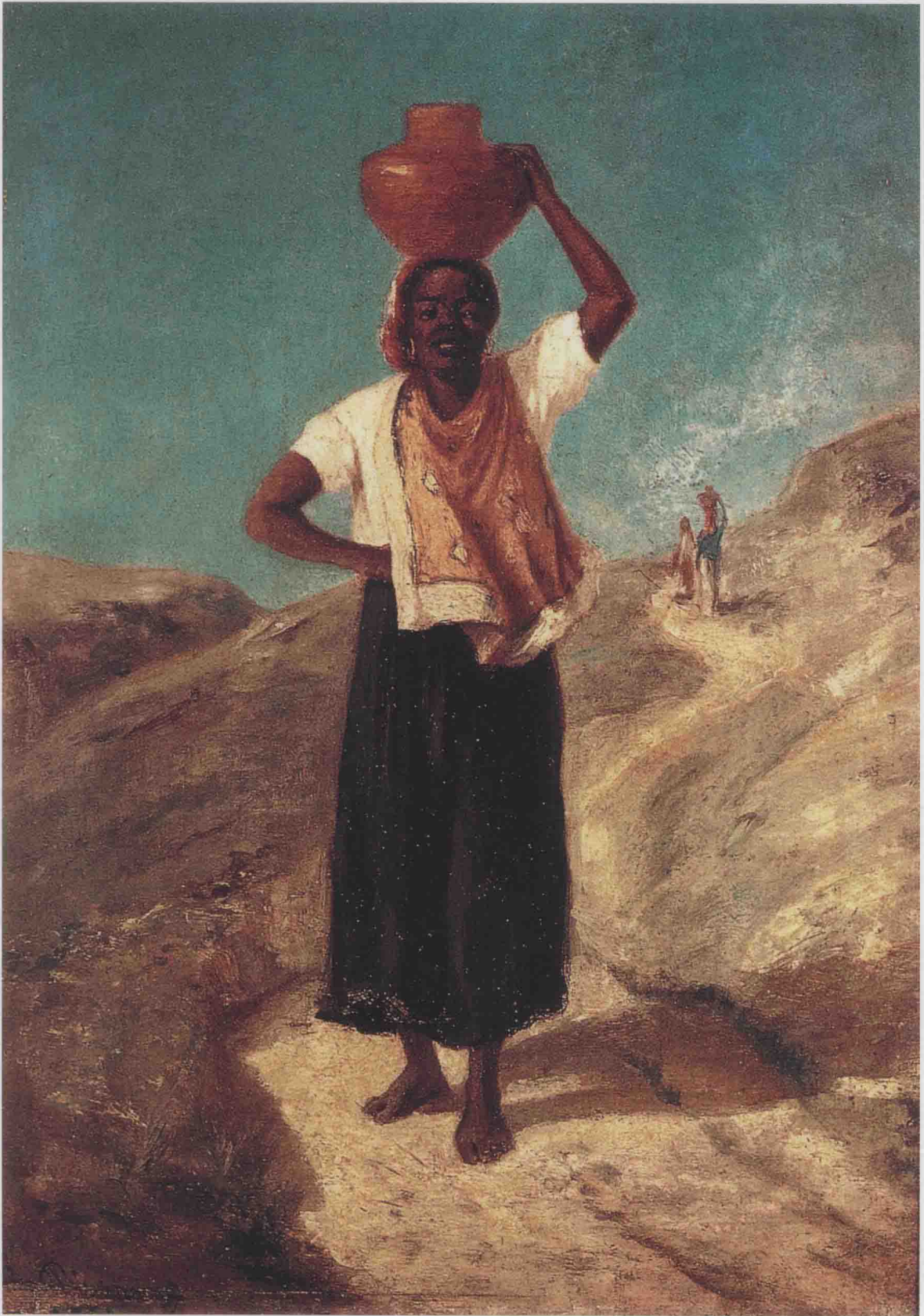
头上顶着水罐的黑人妇女 1854—1855年 33cm × 24cm