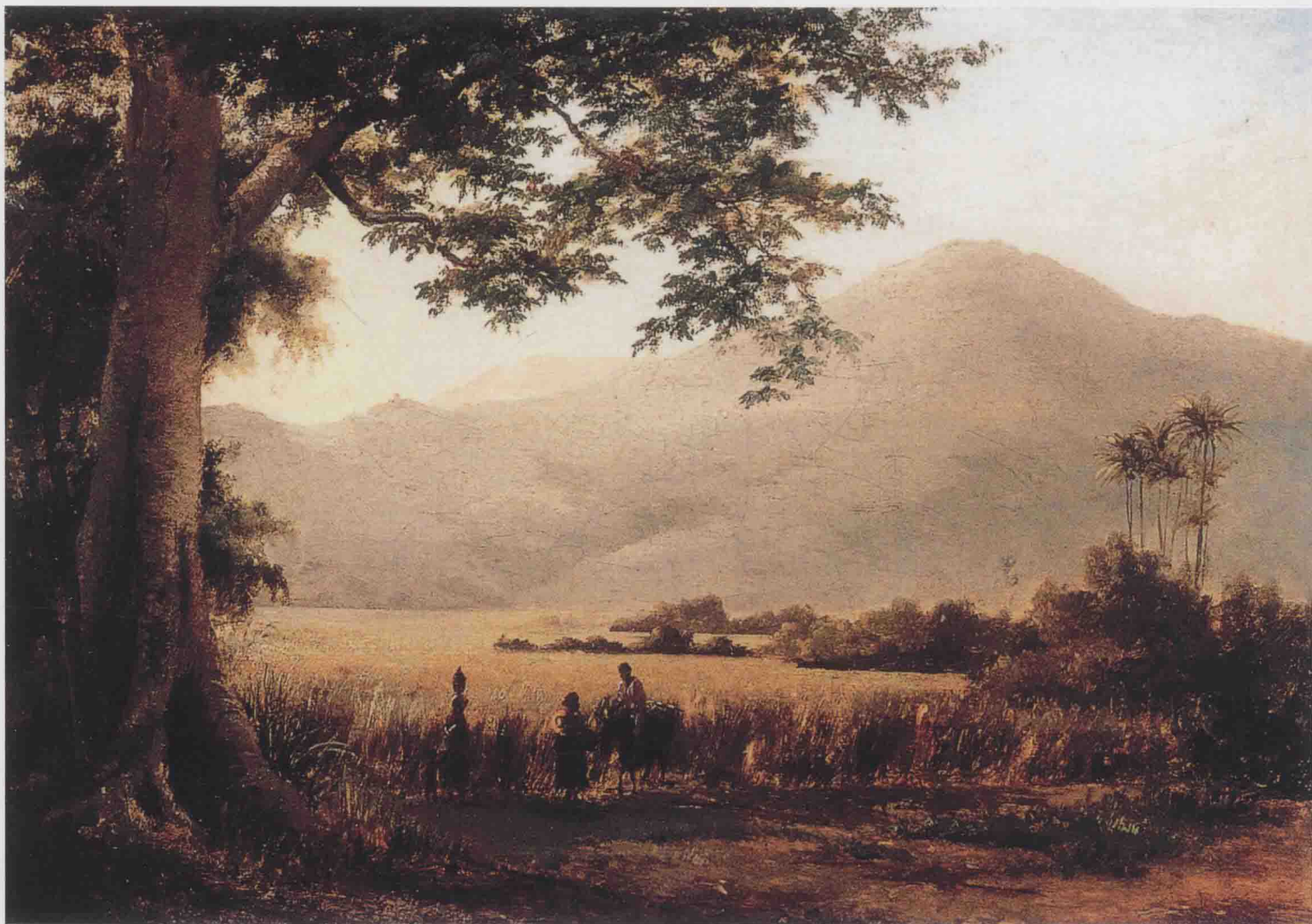
乡村小路上的交谈 1856年 32.5cm × 46cm

不久，世界博览会在巴黎开幕。通过博览会，毕沙罗不仅结识了塞尚，还拥有了自己的艺术圈。经过塞尚的介绍，他认识了吉约曼、左拉、莫奈，并在莫奈的引荐下，参加各种艺术沙龙的活动，又结识了马奈、雷诺阿、西斯莱等绘画大师。此时的毕沙罗在巴黎如鱼得水。