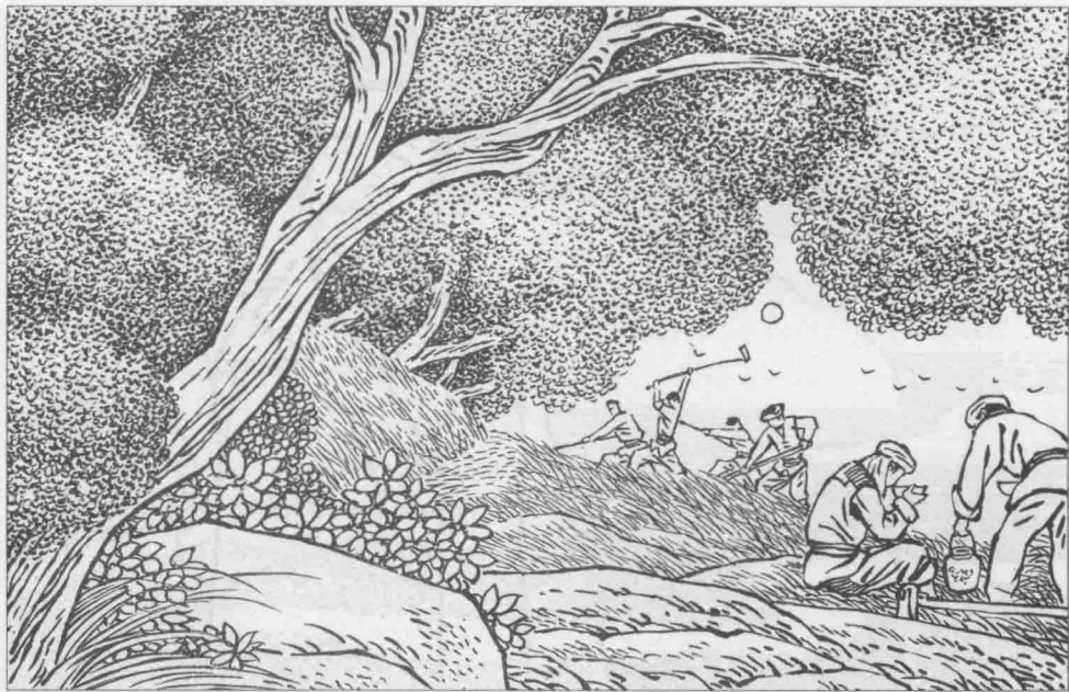
2 胡耀邦的故乡在浏阳市的中和乡苍坊村。据记载，胡家先祖是客家人，明末为避战乱，由江西迁至湖南，定居在浏阳西岭山脚的敏溪河畔，风雨沧桑数百年，以耕读安身立命。