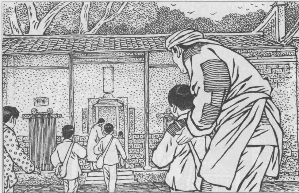
8 1922年，胡祖仪创办了新式学堂“兴文小学”，不仅课程设置、教学方法和以前不同了，还招收女生。 胡耀邦自然成了兴文小学的学生。