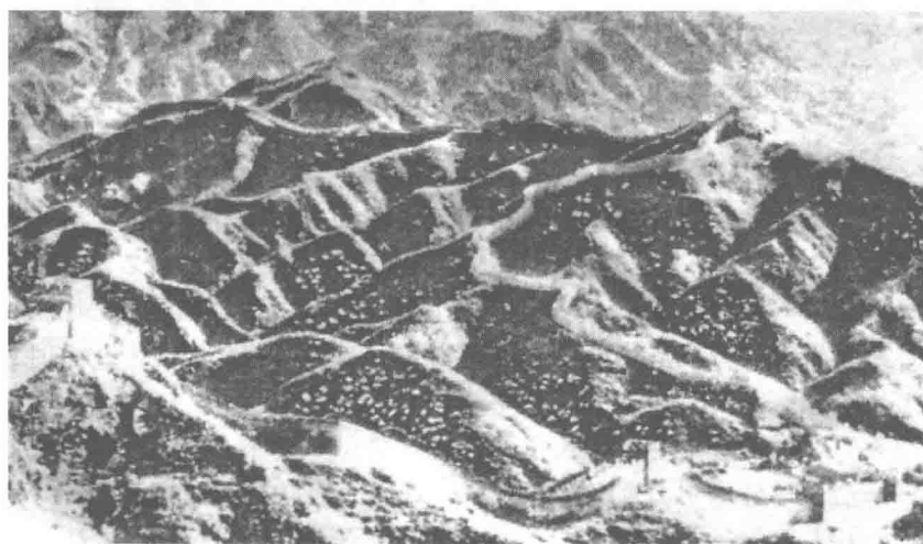
图 1-2 山地

山地是层峦叠嶂、脉络明显，高差大于 200 米，坡度较大的地表形态（图 1-2）。这种地形上，地表岩层裸露或离地表很浅，起伏连绵，多绝壁悬崖，河谷深切，水流湍急；居民地区沿河谷分布，密集的大居民地稀少，道路网不发达，主要干线公路较平原、丘陵地形上的少且等级低，而且坡度、方向变化大；其植被要素受气候和海拔的共同影响很大，我国山地地形的植被覆盖率极不平衡。当在山地地貌上覆盖有森林时，则形成山林地形。在热带则形成热带山林丛林。