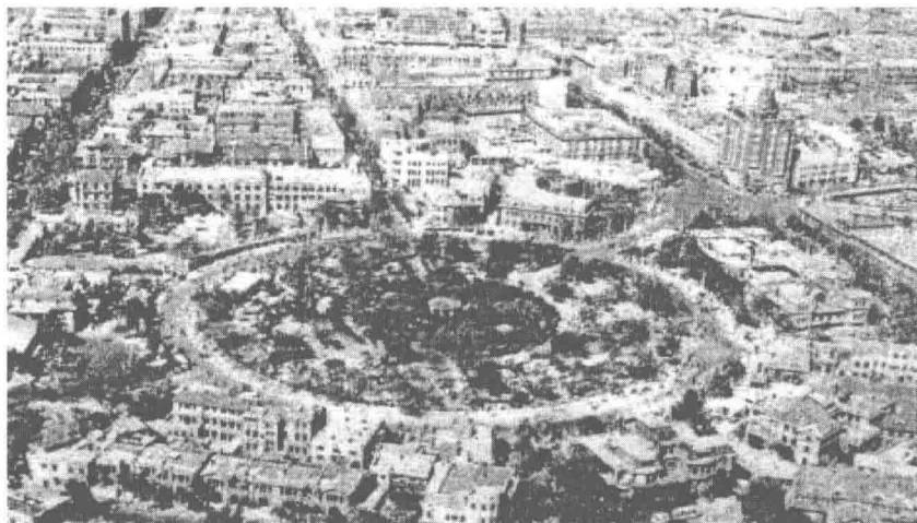
图 1-4 居民地

人类集聚定居的地区叫居民地（图 1-4）。居民地按其性质与人口数量的多少分为城市、集镇、村庄。城市通常是某一地区政治、经济和文化中心，也是当地交通枢纽。人口众多、建筑高大密集而坚固，建筑设施较多，交通方便。集镇相对城市而言，范围较小、人口较少、建筑不如城市高大坚固密集，地下建筑设施较少，交通较城市便利。村庄是较小的居民地，人口不多，房屋矮小，多平房院落。