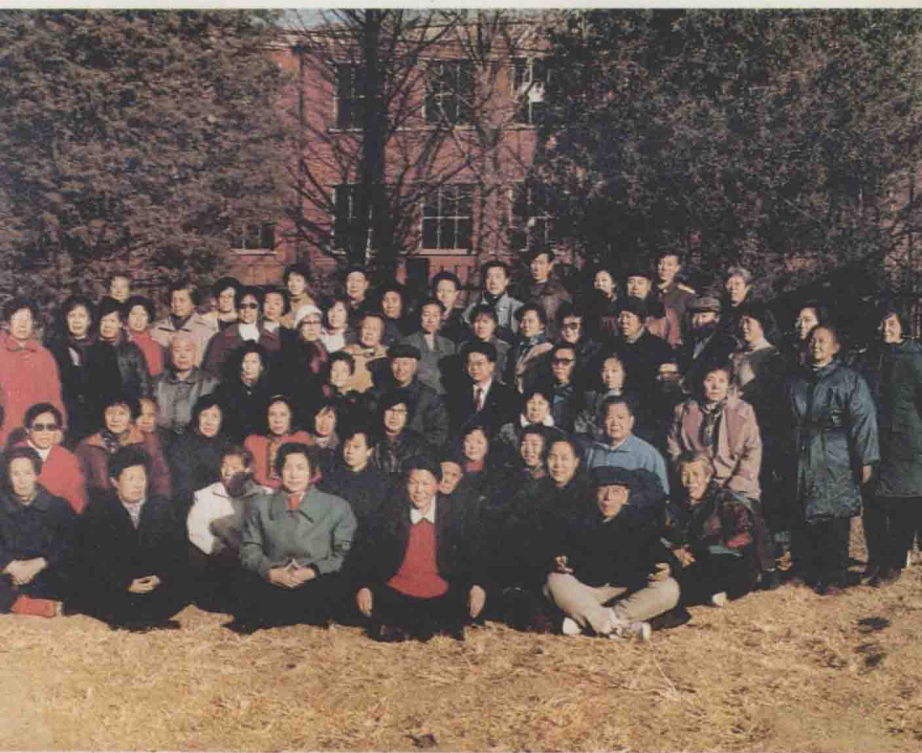
天山气功的受益者——本书的作者们