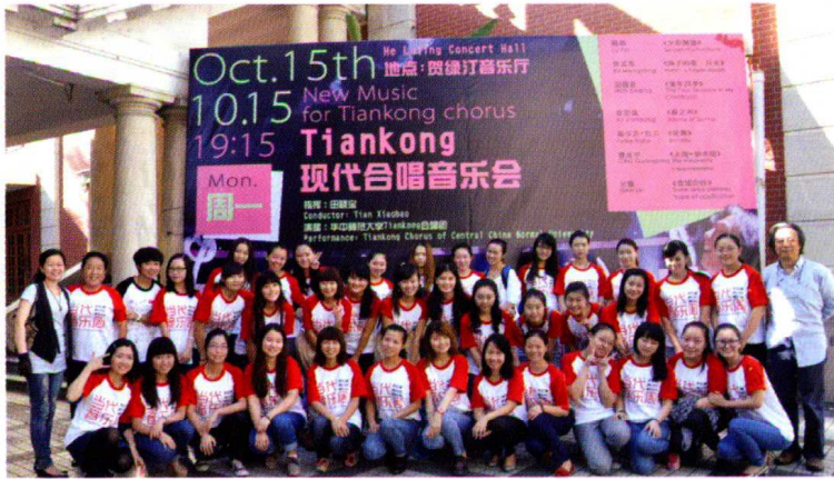
2012年第5届上海国际当代音乐周·现代合唱作品音乐会