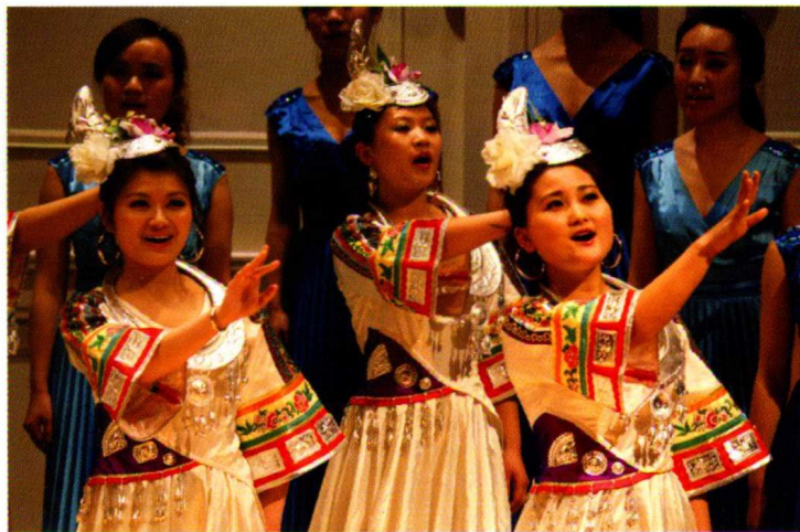
2011年美国巡演——《高原，我的家》