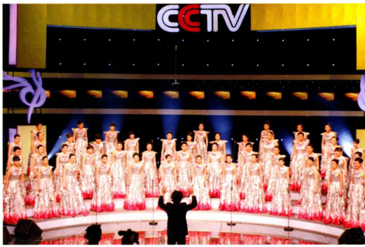
2008年第13届CCTV全国青年歌手电视大奖赛