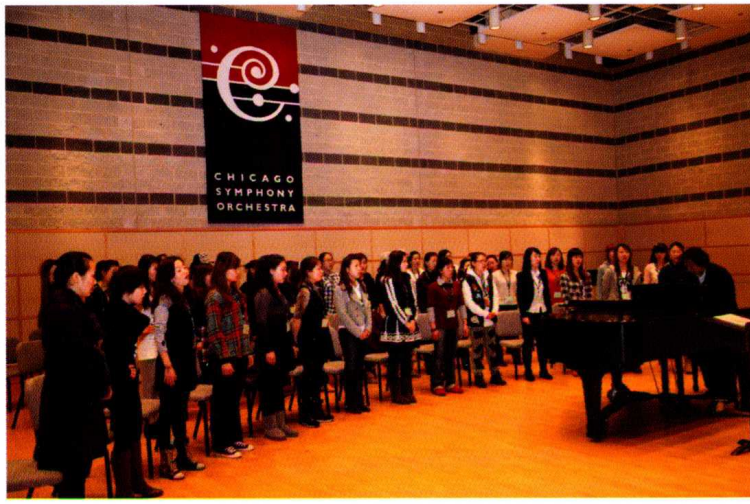
2011年芝加哥交响音乐厅演出前排练