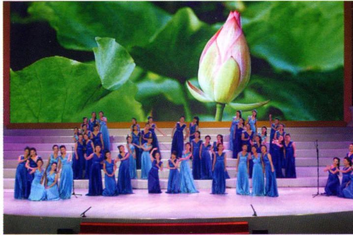
2009年CCTV爱国歌曲大家唱——《洪湖水，浪打浪》