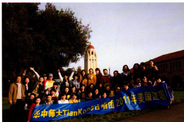
2011年美国巡演——斯坦福大学