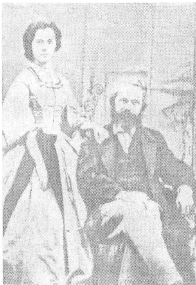
妮 燕 · 思 克 馬