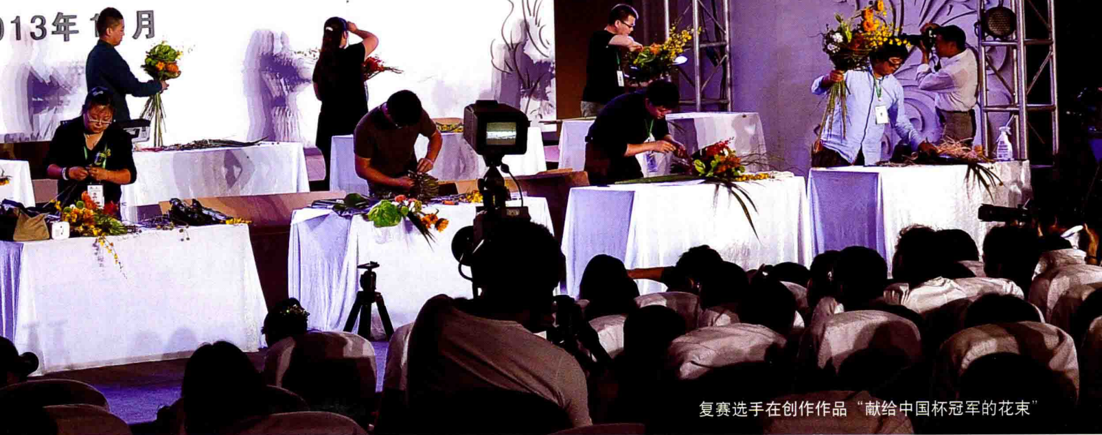
复赛选手在创作作品“献给中国杯冠军的花束”