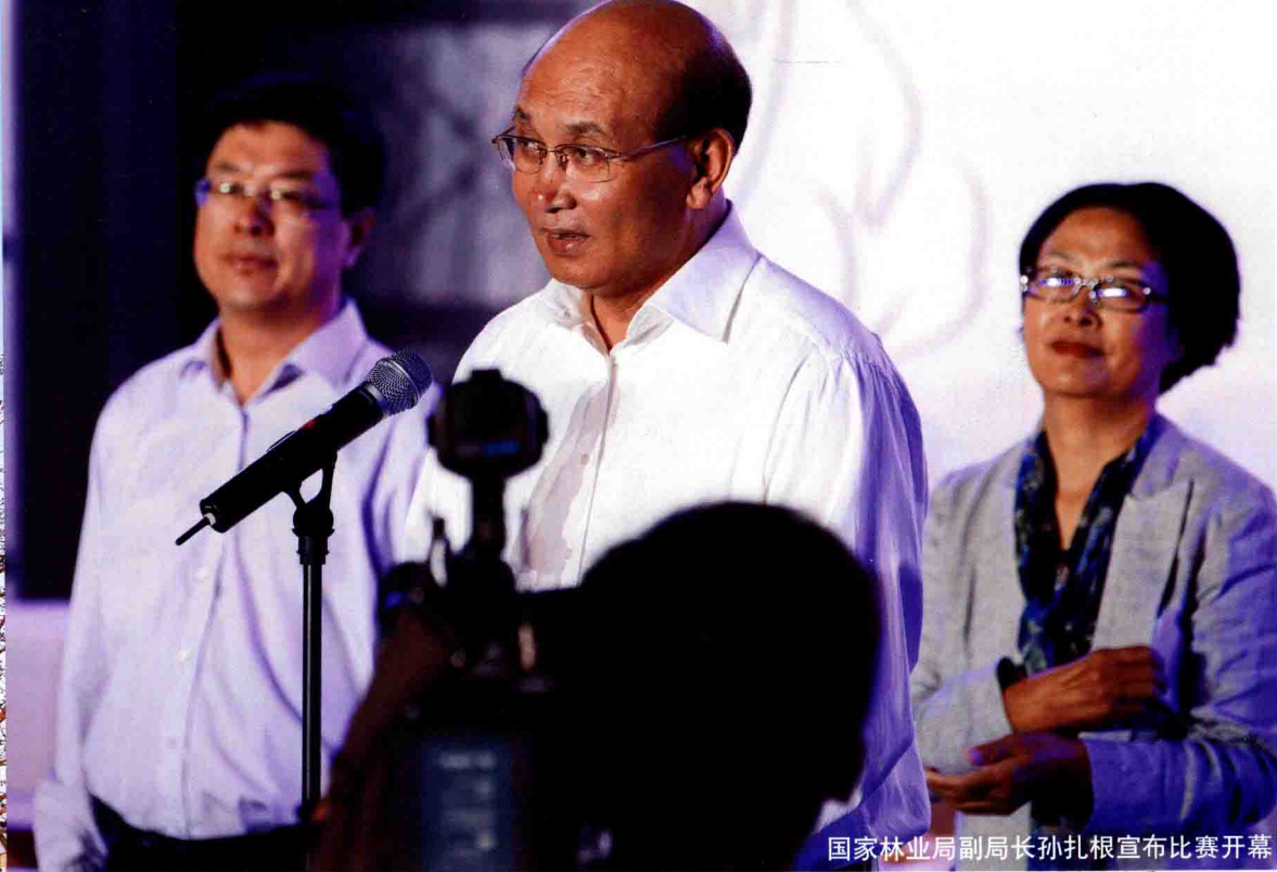
国家林业局副局长孙扎根宣布比赛开幕