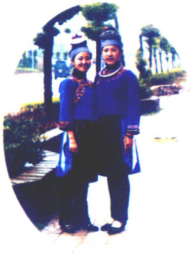
苗族女性服饰（城江型）

人称“白领苗”；排调大部的村寨，穿无领紧袖对襟短裙，衣扣对胸，而且颇多，服色尚黑，以土布为主要装饰，族外人称“短裙苗”；南皋大部的村寨包头