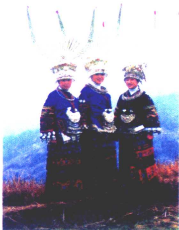
苗族妇女盛装（孔庆型） （李道江 供稿）

巾，穿无领短衣、适中裙，服色尚黑，仍以土衣为主要装饰，族外人称“舟溪苗”。这些女装盛装时不包头巾。