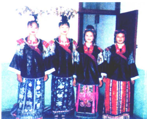
苗族妇女盛装（排莫型蜡染式）

服色尚蓝、尚黑、尚青，以土布为主要装饰，族外人称“八寨苗”；排调镇乌威和扬武乡的排莫、排倒、基加、乌湾等地，服色尚黑，所有土布均以蜡染和牛血等动物性物质浆染为主要装饰，族外