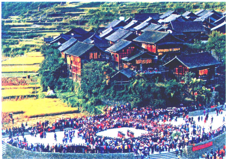
盛会 A grand gathering

苗年是苗族祭祀祖宗和庆祝一年收成最隆重的节日，活动内容有宴请亲友、吹芦笙、跳芦笙舞、斗牛、赛马等，时间短为