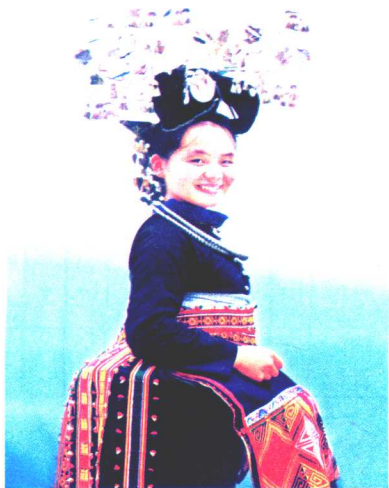
端庄典雅的锦鸡服饰