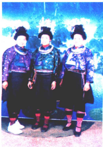
苗族妇女盛装（龙泉型八寨式）