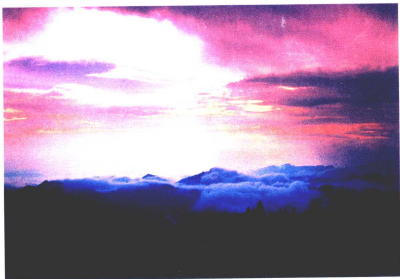
云海 The sea of cloudy

丹寨县介于东经 108^{\circ} 08' —东经 107^{\circ} 44' ，北纬 26^{\circ} 05' —北纬 26^{\circ} 26' 之间，位于贵州省东南部，黔东南苗族侗族自治州西部，东接雷山县，西靠都匀市和麻江县，南临三都水族自治县，北与凯里市接壤，面积937.7平方千米，辖3镇4乡，1个国营农场，总人口16.59万，是一个以苗族为主，拥有汉、水、侗、布依等18个民族的多民族聚居县，县政府设在龙泉镇。县城距黔桂