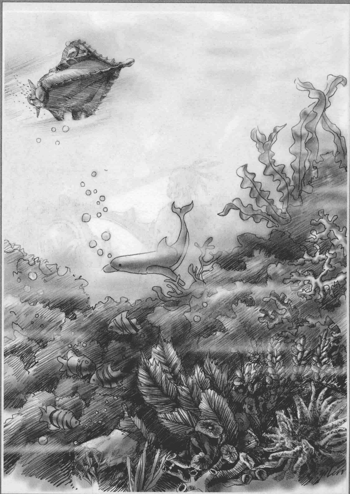
在海脊上，在岩石和火山岩构成的海底，长满着各种各样的生机勃勃的海洋植物。