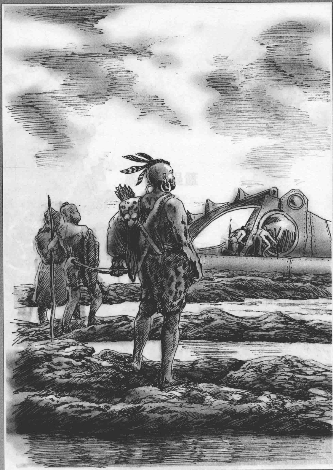
有几个土著人利用海水退潮，跑到珊瑚礁顶，离“鸚鵡螺”号不足两链远。我能很容易地看清楚他们。