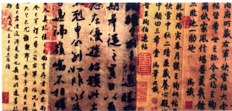
东晋 书法 伯远贴

晋永和四年（公元348年），慕容皝病逝后，次子慕容俊继承了王位。慕容俊在位期间，于晋永和六年（公元350年）率军攻克并迁都于蓟城（今北京西南）。晋永和八年（公元352年），慕容俊率兵攻打冉魏，并逼杀了冉魏皇帝冉闵，灭了冉魏，同年慕容俊称帝，建元元玺，并迁都于邺（今河北临漳西南）。在慕容俊的统治下，前燕国势空前强大。公元359年，慕容俊在邺城屯兵百万，准备攻取洛阳之时，却身患重病，并于次年（公元360年）不幸病逝，终年42岁。死后被谥为“景昭皇帝”。