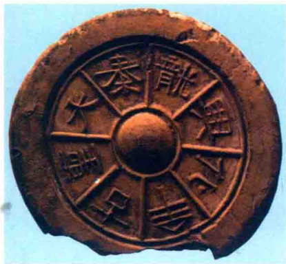
前秦 大秦龙兴化牟古圣瓦

脱离了后赵，投奔了东晋，且当上了东晋征北大将军、冀州刺史、广川郡公。此时手握重兵的苻洪已经不甘为人臣了。公元350年苻洪自称大将军、大单于、三秦王，并扬言说道：“我领兵10万，不费吹灰之力便可以把冉闵、慕容俊、姚襄父子消灭。夺取天下，可谓易如反掌。”就在他雄心勃勃准备成就霸业时，没想到在一次宴会上，他的军师、大将军麻秋下毒害死了他，死时66岁。死后被谥为“惠武帝”。