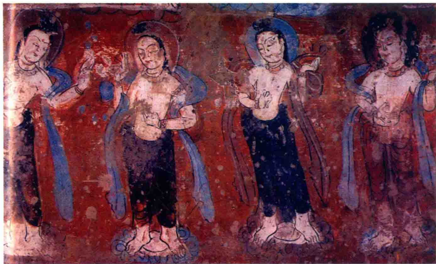
十六国壁画 敦煌石窟第二十五窟 供养菩萨

太宁元年（公元349年）十月，石勒养孙石闵派部下杀死了彭城王石遵，拥立义阳王石鉴为皇帝。石鉴即位后，封石闵为大将军，时隔不久又感到大将军石闵对于自己的皇帝位极具威胁，便派龙骧将军孙伏都领羯族士兵3000名趁夜间偷袭石闵，不料想孙伏兵败而逃，石鉴也被石闵关押了起来。青龙元年（公元350年）正月，石闵下了大屠杀令，一次杀死了包括石鉴在内的近万人。这位当了103天的皇帝死后，被人们称做“义阳王”。