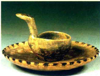
东晋 十六国 青釉虎子

等人把持。刘曜在长安建立前赵政权后，在蒲光等人的逼迫下苻洪投靠了刘曜，被刘曜封为率义侯。公元329年前赵灭亡，苻洪率众归附后赵太祖石虎，为流人都督，率两万户迁居枋头（今河南浚县西南），并在此地果断地