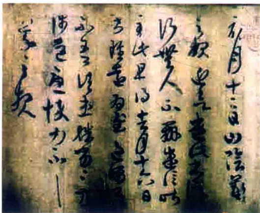
东晋 书法 初月帖

苻生不但是一位杀人成性的恶魔，而且还是一位十足的酒鬼色魔。他每次喝酒时，必须喝醉，而且陪酒者也定要喝的大醉，不然的话陪酒者便会有杀身之祸。此外，苻生的荒淫在历史上也是非常有名的。据说他常常逼迫一些男女，有时甚至是他的兄妹，在光天化日、大庭广众下赤裸裸地发生性关系，如果有违抗命令者，立即处死。寿光三年（公元357年）六月，就在苻生准备杀死他的堂兄东海王苻坚时，反被苻坚所杀，终年23岁。