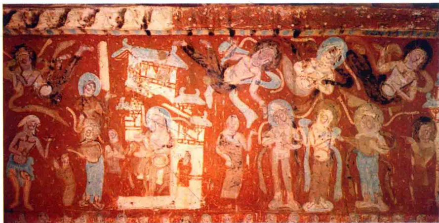
十六国壁画 敦煌石窟 出四门全图