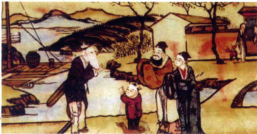
东晋 绘画 桃园问津图