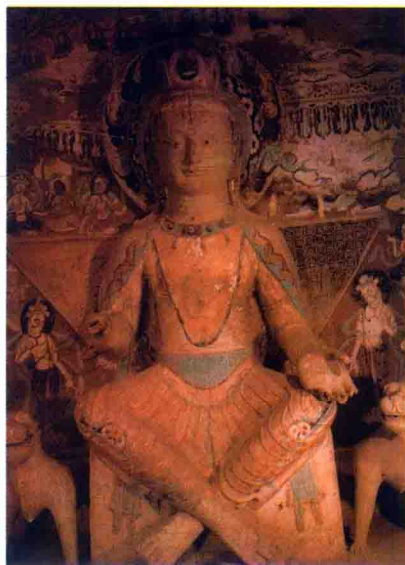
十六国壁画 敦煌石窟 主尊交脚菩萨

除此之外，石勒在位期间针对北方少数民族和汉族杂居的现状，实施了整饬风俗、革除陋习、禁止酗酒、