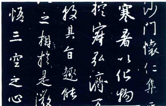
东晋 书法 集王圣教序碑

坚壁清野，迫使桓温撤军。始皇五年（公元355年），一心想篡夺皇位的苻萑（苻健侄）发动了政变，欲夺皇位，但未成功即被苻健所杀，从此后苻健一病不起，不久