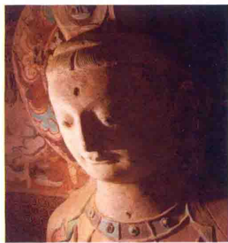
十六国壁画 敦煌石窟 主尊胸像

尊重各民族婚丧嫁娶的习俗等一系列的有力措施，从而促进了民族之间的和睦。最让人称道的是，石勒作为一代帝王，他非常有“自知之明”。后赵建平三年（公元332年），将近花甲之年的石勒，在一次宴会上宴请高句丽、宇文屋孤使者时，借着酒兴他问身边的大臣徐光说：“我可以与前代哪位皇帝相比？”徐光答道：“陛下的英明高于汉高祖刘邦。”而石勒却笑着说：“人贵有自知之明，你说得太过分了。如果我遇到汉高祖，一定向他称臣。”后来，石勒在自己病重时曾下令自己死后，三日而葬，朝廷内外不准穿丧服，期间不准禁止婚娶、祭祀、食肉等。此外征镇牧守不准前来奔丧，下葬时穿普通衣服，送葬时用一般的车辆，棺内不藏金玉器玩，用土葬。建平四年（公元333年）七月，一世英明的出色政治家石勒因病去逝，终年60岁。死后被谥为“明帝”，庙号“高祖”。