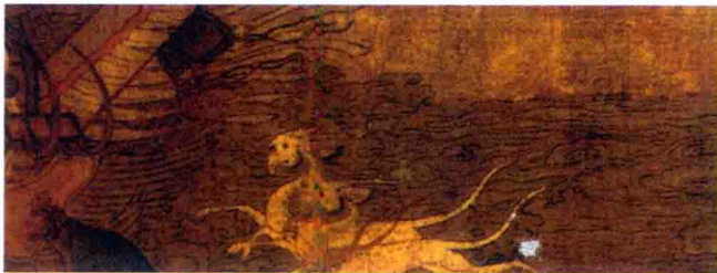
东晋 顾恺之 洛神赋局部

权，这使得石闵极为愤怒。中书令孟淮等人劝石遵杀了石闵以绝后患，但遭到郑太后的反对，未成功。