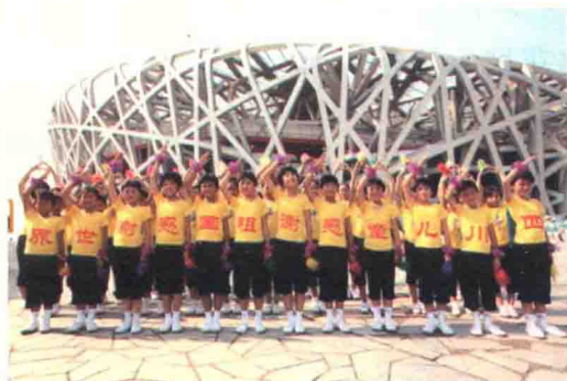
图 1-2 参加奥运花毽表演的四川儿童

2008年8月17日，由北京市毽绳运动协会组织的花毽表演方阵在奥运会鸟巢体育馆女子马拉松比赛现场中炫目亮相，包括来自四川地震灾区的十二名儿童和怀柔区泉河街道花毽表演队在内的花毽选手精彩献艺。这十二名来自四川地震灾区的儿童以独特的方式表达他们对祖国和人民的感恩之心，他们充满民族文化底蕴的演出博得了现场数万名观众热烈的掌声。