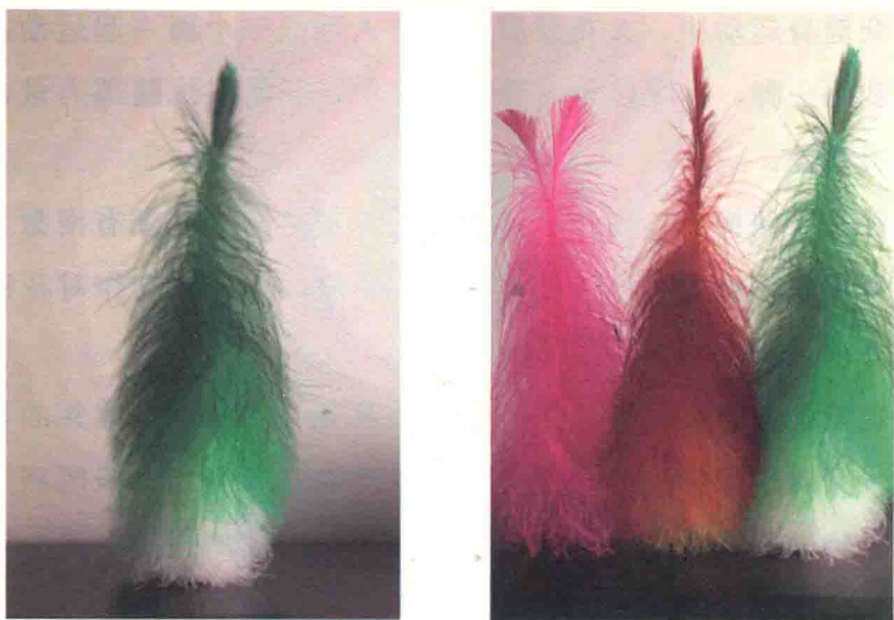
图 1-8 观赏毽