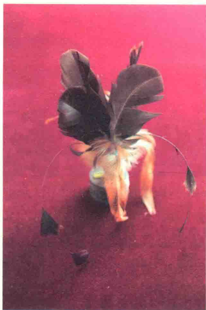
图 1-5 各式鸡毛毽

第二种是鹅毛毽。这种花毽的毽身多用鹅毛制成，橡胶做底座，高度为 17~18 厘米。与传统花毽不同的是，大花毽比较重，要求技巧性相对简