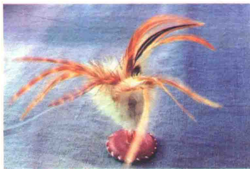
图 1-4 自制的鸡毛毽

线缝牢，成为底座；然后在未剪开的鹅毛管子上端，插上七八根鸡毛，自制的鸡毛花毽就做成了。鸡毛一般用公鸡的，又长又好看，最好是公鸡尾巴两侧的，其次是公鸡颈部的，那两个部位的羽毛最是修长美观，惹人喜爱。