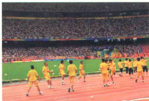
图 1-3 怀柔区泉河街道花毽表演队奥运献艺

来自怀柔的泉河街道花毽队是远郊区县首支出现在鸟巢的健身队，这支花毽队8月24日在鸟巢男子马拉松比赛现场再次展现了他们的英姿。