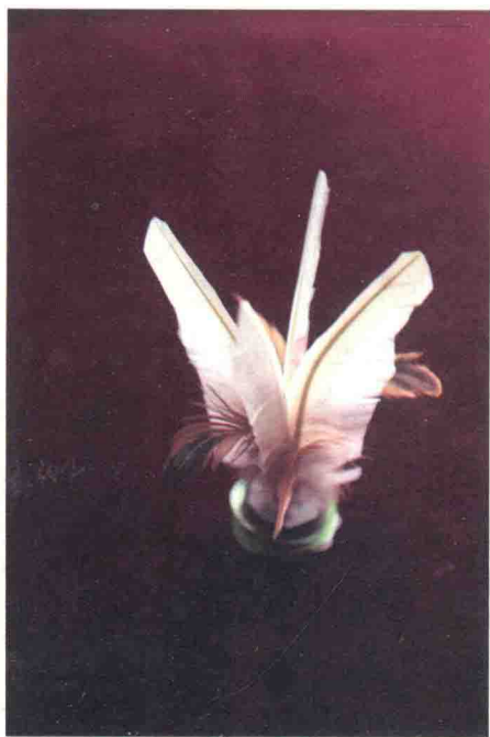
图 1-6 鹅毛毽

第二种是鹅毛毽。这种花毽的毽身多用鹅毛制成，橡胶做底座，高度为 17~18 厘米。与传统花毽不同的是，大花毽比较重，要求技巧性相对简