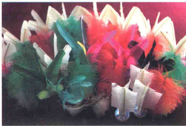
图 1-1 形色各异的毽子

花毽，亦称花式毽，是毽子的一种。在古都北京，毽子有一个富有诗意的名字——翔翎，如今，有的人也称花毽为翔翎。提到花毽，大家脑海中便会联想到形态各异、色彩斑斓的毽子。