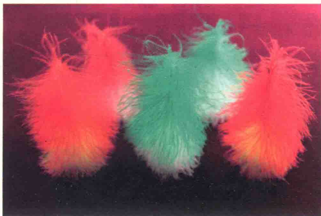
图 1-7 高级花毽

高级花毽：说它高级只是因为它的重要组成部件——雕翎的稀罕，雕本来就稀少又属于保护动物，一只雕的身上大概只有二十根的羽毛可以用来做花毽。物以稀为贵，所以才出现雕翎很难买到的现状。多少年来为花毽找雕翎的代用品，已经是几代人的奋斗目标。