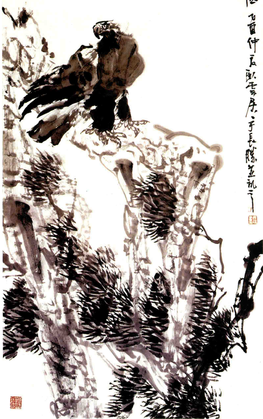
远天云低 68cm x 136cm