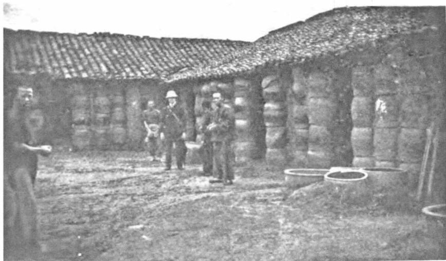
◆ 一家陶器制造厂——墙壁是用假的陶罐做的