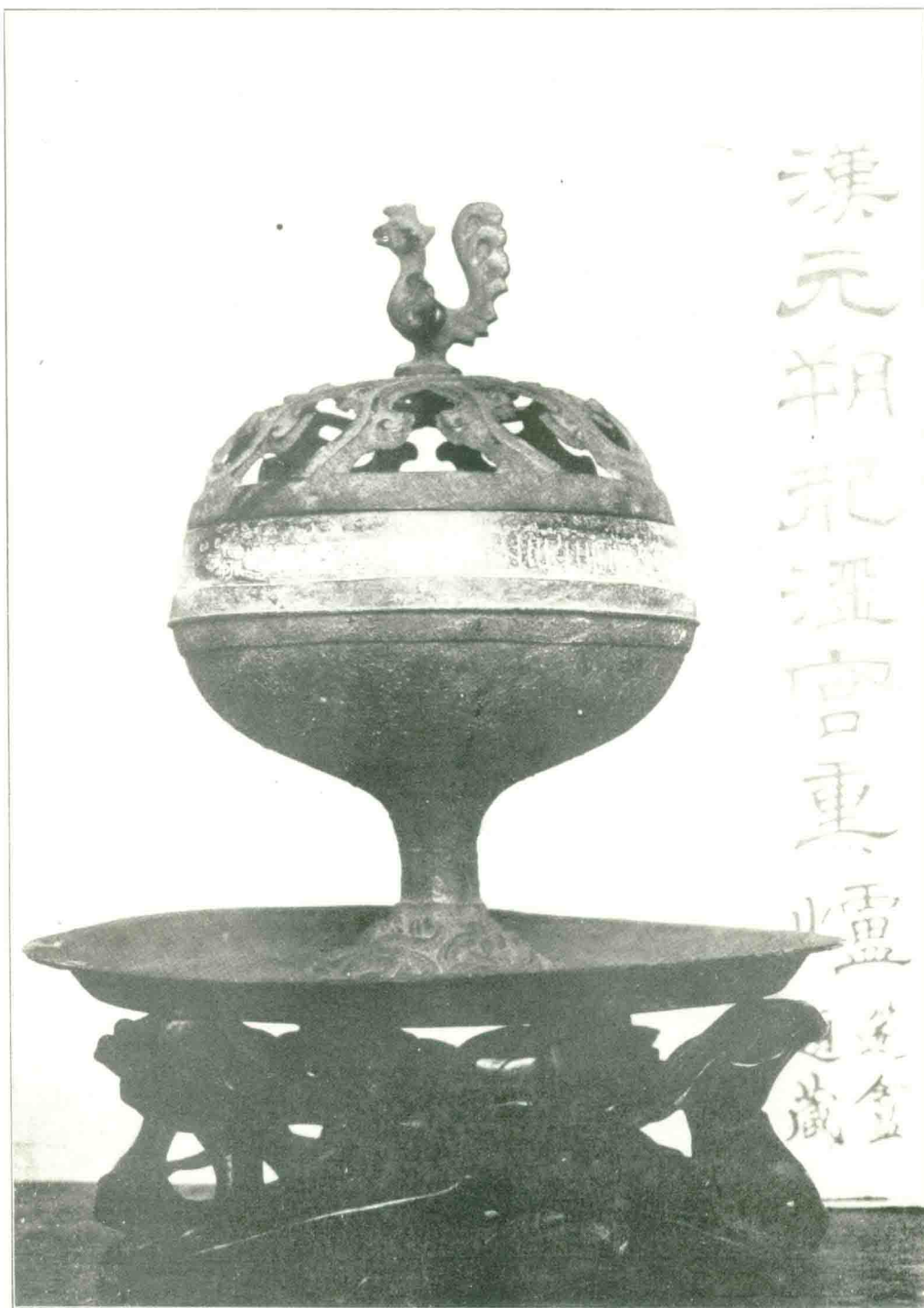
漢元朔祀涇宮熏爐和元 小圖揚氏 原於小圖揚氏 器原於小圖揚氏 十分之三