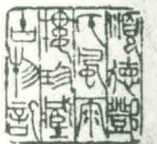
漢 戰 原 樣 六 風 雨 樓 藏 本