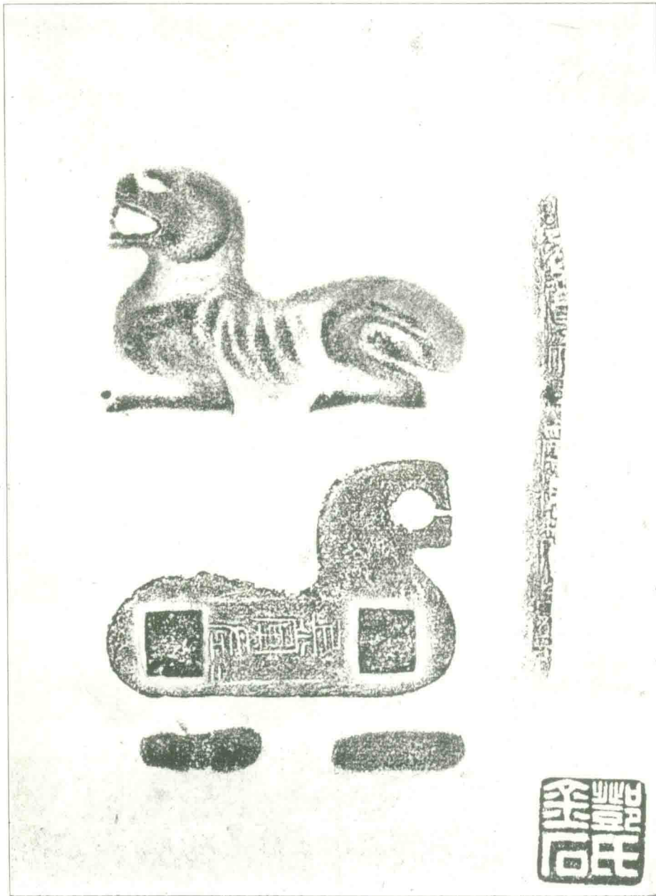
漢上黨太守銅虎符原樣大風雨樓藏本