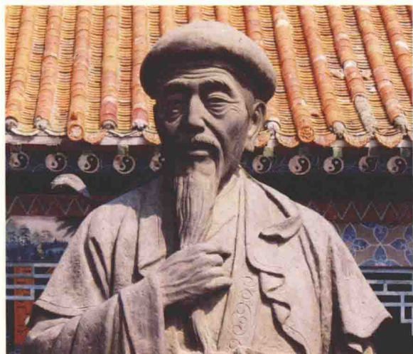
太极拳始祖——陈王廷