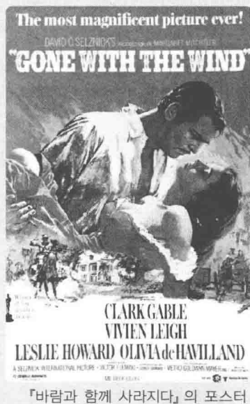
『바람과 함께 사라지다』의 포스터

이 소설의 여주인공 스칼렛을 내가 사랑하는 이유는 상실과 5) 실패 속에서 오히려 더욱 강인하고 성숙해질 뿐 아니라 절망 속에서도 ‘또 다른’ 시작을 할 수 있는 그녀의 능력 때문이다. 그