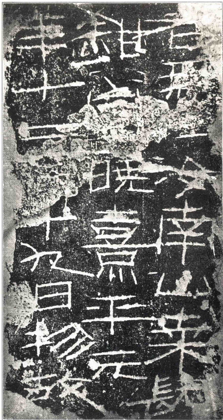
漢口曉葬志 縮存之十七 唐風樓藏

此志中年治未人之數出於刻字之制全至而完字之影印者 近洛與鐵所得時知百文皆多端橋軍得者少全文印