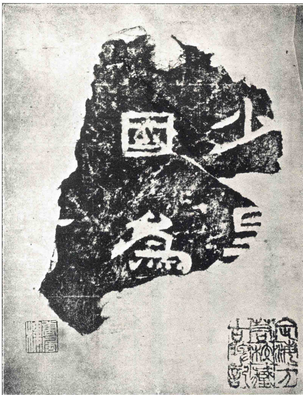
魏 黃 初 殘 碑 原 樣 大 唐 風 樓 藏 此 殘 石 三 第 一 石 也 第 一 石 久 供 至 難 得 餘 二 石 尚 存