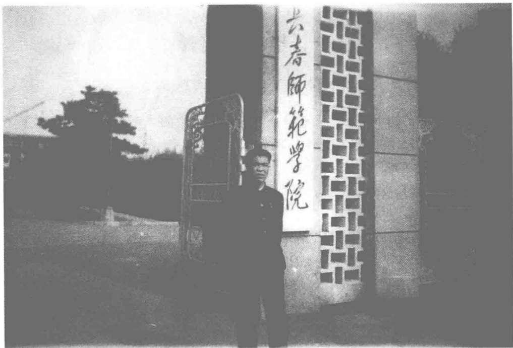
十年后，回母校留照

妻子、儿女都借点光，农村的那个苦日子你还没过够吗？”我心里想：“农村怎么就像十八层地狱那么怕人？”又一个同学劝我说：“你在城里，踏踏实实干几年，很快就会成个名教师。到农村，条件差不说，谁能发现你呢？”我说：“古人说：‘生于忧患，死于安乐’，一方水土一方人，也许农村这块土地更适合我成长。”我对待客观环境的态度是：一是了解，二是熟悉，三是适应，四是改造，五是利用。我是当地人，对当地的情况了解、熟悉，也适应，剩下的就是改造环境、利用环境了，这在事业追求的路上，无疑是一条捷径。20年后，有位记者访问我，问我为什么回乡。我对她说，我的理论就是“一个坑里种几棵玉米”的问题：打个比方，“文化大革命”时追求高产，一个坑里种4棵玉米，结果棵棵都长不好。人才都在城市扎堆，就像4棵玉米挤在一个坑里。我选择了农村，这一个坑里就我一棵玉米，我的事业发展自然会得天独厚。再者，农村教育落后，然而，越是落后的地方越需要人，越是落后的地方待开垦的“处女地”就越多。从干事业的角度来看，我应该选择农村。我几次