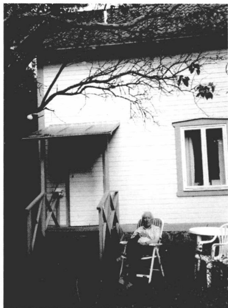
托马斯和蓝房子（2011年）