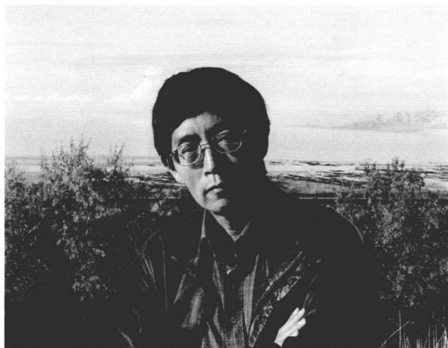
2001 年从美东开车到美西的路上