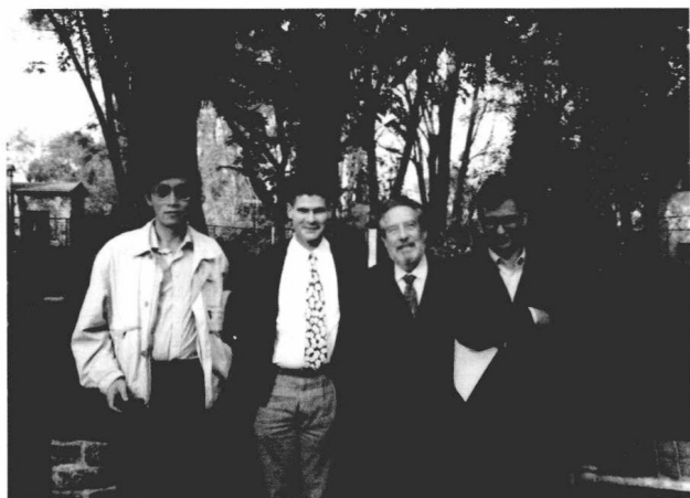
与帕斯（右二）在墨西哥莫尔里亚（1993年）