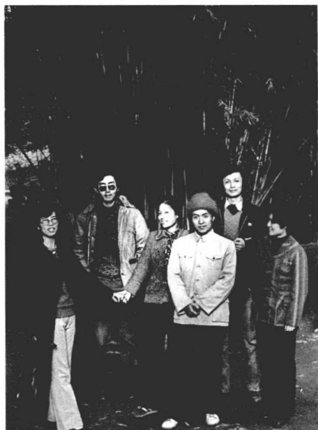
舒婷、北岛、谢烨和顾城等在成都 (1986年)