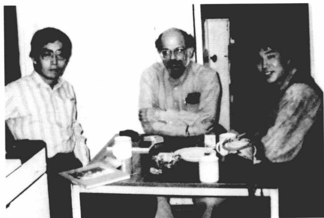
和艾伦·金斯堡、严力在金斯堡家（1988年）