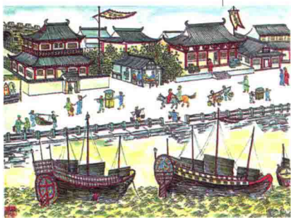
↓ 画家笔下的古镇海

周氏祖籍浙江镇海（现属宁波市辖区），古曰蛟川，与上海一衣带水，位于长江三角洲南翼，东屏舟山群岛，西连宁绍平原，南接北仑港，北濒杭州湾。镇海历史悠久绵长，据考证，早在新石器时代就有了人类居留的痕迹。宋朝时，仗借其“浙东门户”的优越地理位置，“海上丝绸之路”即以镇海为起碇港，成批的丝绸、瓷器、茶叶远销四方，换回不可计数的香料、黄金、奇珍异兽。一拨紧接一拨的镇海人依靠溯江航海的便利，漂洋渡海、经商求学，弄潮于世界舞台，声名赫赫的“宁波帮”因此催熟而出。惜古往今来，福无双至。正因占据险要的