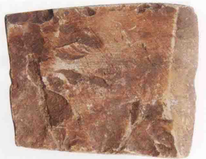
六山岩遗址出土一石斧