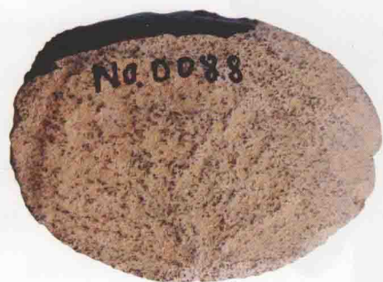
青龙头遗址出土—石饼