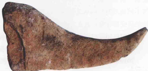
久山湖遗址采集—石镰