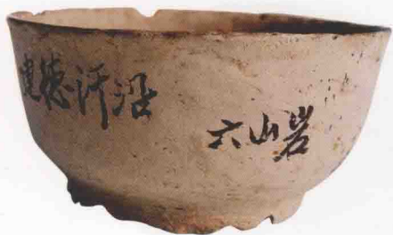
六山岩遗址出土—灰陶小碗