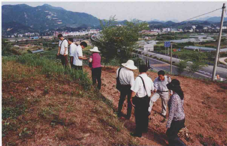
国家普查组专家对青龙头遗址实地验收