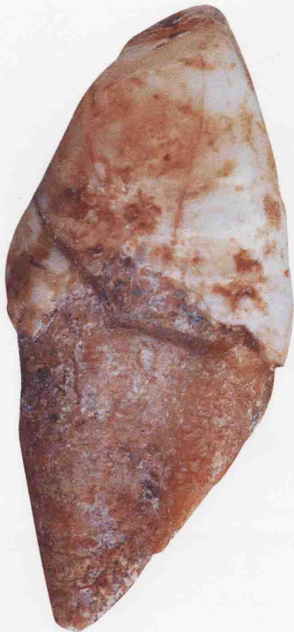
“建德人”遗址出土的人牙

出土的那枚人类右上犬齿化石，齿冠高11.6毫米，远中近中径为8.2毫米，唇舌径为9.5毫米。根据其形态、出土的层位以及同时出土的古生物资料，可以判断属于柳江人一类的智人类型，距今10万年左右，定名为“建德人”。