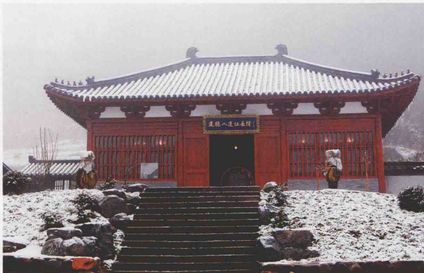
“建德人”遗址展馆正面

“建德人”遗址发现的人牙化石是浙江省首次发现的旧石器时代的人类化石。它的发现，增加了智人化石在我国分布的新知，揭开了浙江人类发展史的序幕。它使浙江境内没有古人类的状况成为历史，将浙江人类活动的历史从几千年一下子可追溯到十万年前。洞内同时出土的豪猪、猕猴、鬣狗、巨獭、东方剑齿象和纳玛象等16种分属晚更新世早期、晚更新世后一阶段等不同地质时代的哺乳动物化石在长江中下游实属罕见。这对浙江乃至华东地区第四纪哺乳动物的研究都有重要意义。