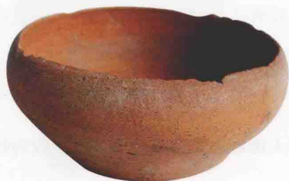
久山湖遗址采集—红陶钵