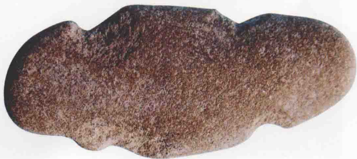
青龙头遗址出土一网坠