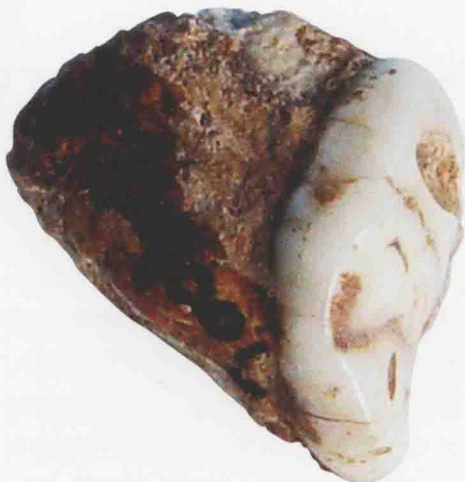
“建德人”遗址出土的大熊猫牙