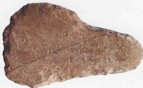
青龙头遗址出土—石钺