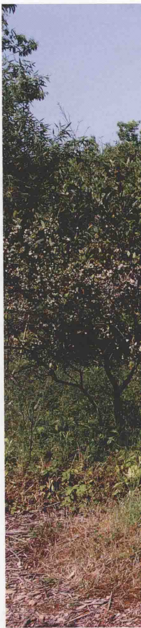
久山湖遗址全景照

1989年11月，县文物办协同杭州市考古所以对久山湖遗址进行了抢救性发掘。本次发掘主要在现存台地的南部进行，共布宽2米、长20米的探沟4条，在台地的北部工厂厂区布东西向探沟1条，另外在台地东南与之相连的小台地上也布了东西向探沟1条，发掘面积总计240平方米。出土的文物有：陶器6件，主要为夹沙红陶和泥质灰陶，还有少量夹细沙黄陶，以素面为主，有少量饰绳纹。器型有鼎、豆、簋、双鼻壶、罐、贯耳壶等；石器17件，器型有段镞、钺、镢、镰等。本次考古发掘探明了遗址的范围和蕴藏情况，出土的文物为研究浙江省新石器时期文化布局，提供了可贵的实证。如将久山湖遗址出土的陶器与太湖流域的良渚文化相比，可以发现这里的鱼鳍形足鼎、双鼻壶、折腹浅盘豆、侈口折腹或敛口弧腹簋、贯耳壶等在良渚文化中都能找到相同的器型，它们应是来自良渚文化的因素。出土的石钺、石镞和采集到的玉锥器型质料也与良渚文化相同。唯有宽折沿