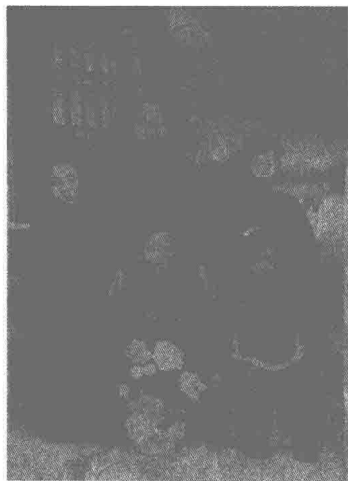
3岁的我与母亲、大哥、二哥、三弟合影

祖父有较深的国学根基，后又就学于位于省会的国民师范，曾任曲沃最早新学的校长、校董。因此，父亲自三四岁起，在祖父的严格教导下，学习四书五经，遍读古籍，有着很扎实的古文化功底。后父亲又就读新学，十四岁时考入省立师范学校，接受了近现代正规师范教育，这一经历又给他奠定了清晰的新青年意识和较好的现代知识基础。省立师范学校毕业后，父亲任教高小。父亲新中国成立前就参加了革命工作，解放初期是全县唯一会使用手风琴的教师。那时全县搞宣传、培训音乐教师，靠的都是父亲的两只脚、一副好嗓子和一架破脚踏琴。父亲在学校任教七年，先后任一高教导主任和校长，后调至县委工作，再后县市合并到市委工作。因工作颇有开拓，成绩显