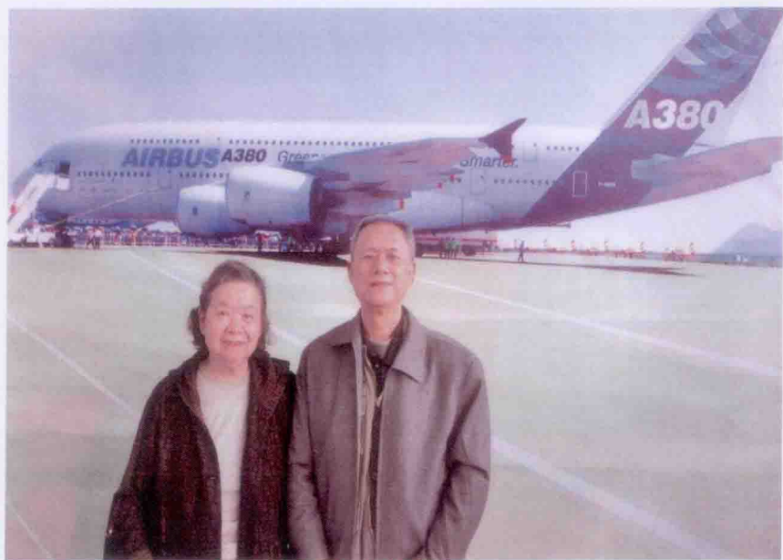
海口美兰国际机场留影 2014 1 6