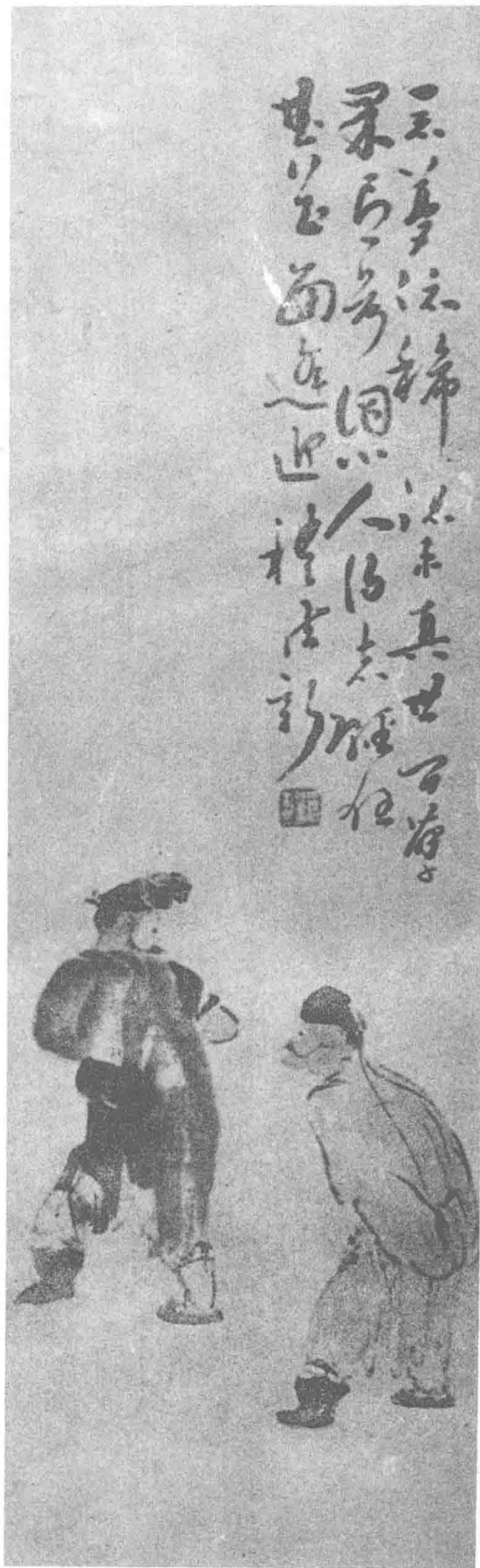
戏曲人物二幅 (清) 吴锡珪 作