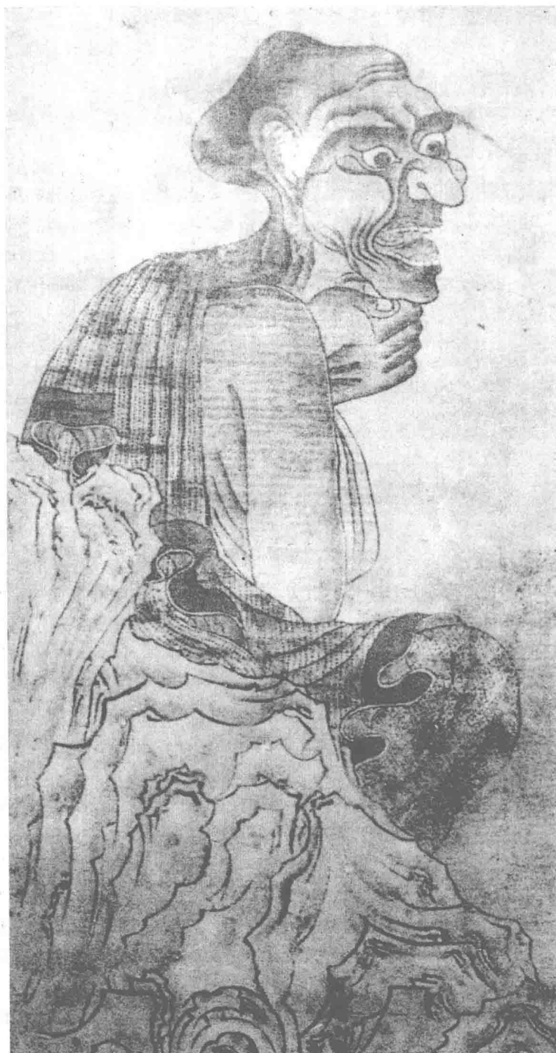
罗汉图 (五代) 贯休 作