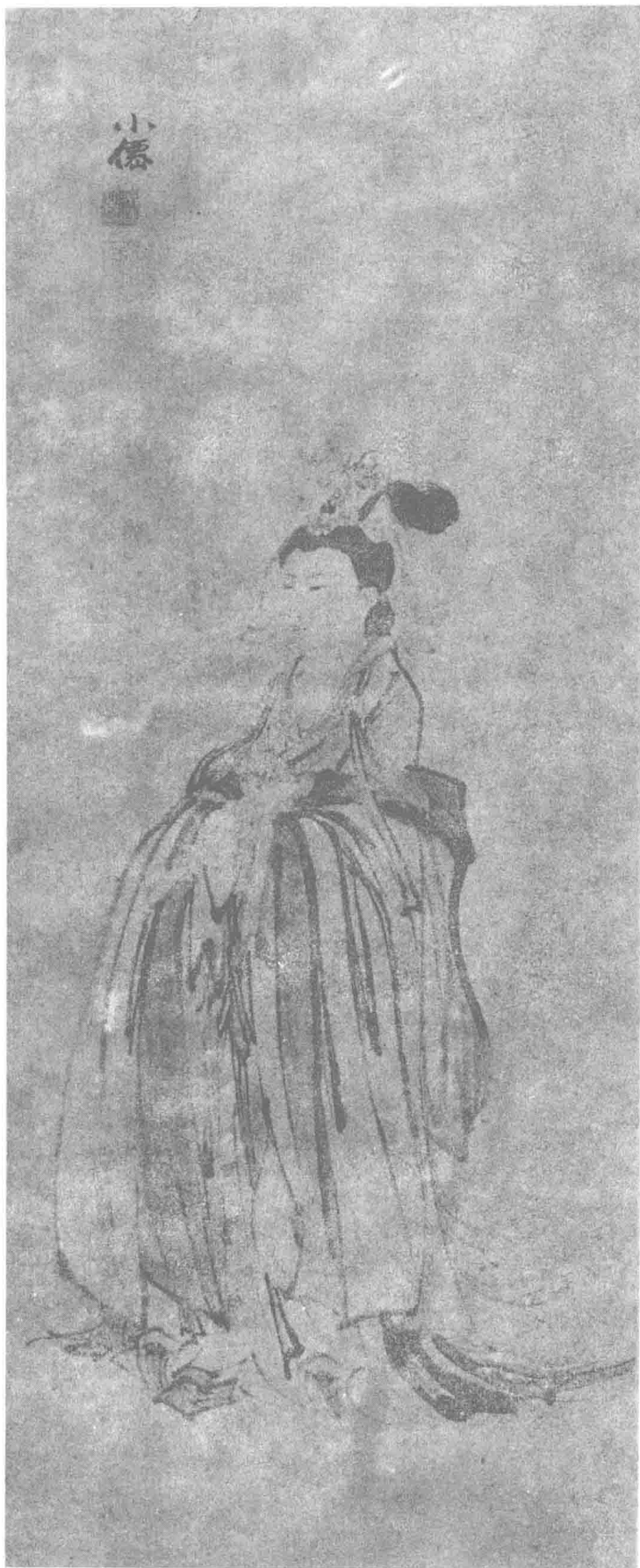
仕女图 (明) 吴伟 作