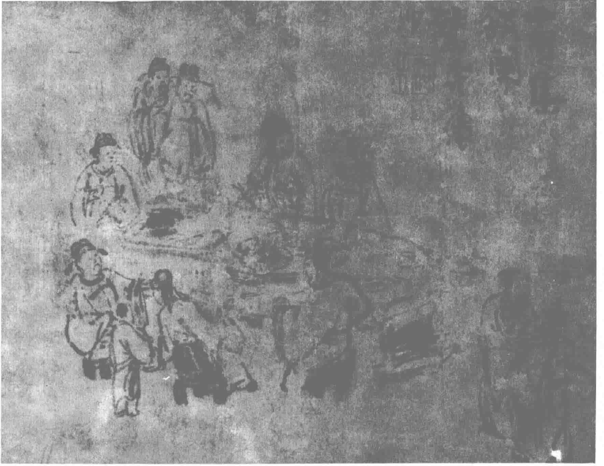
十贤集饌图 (明) 徐渭 作