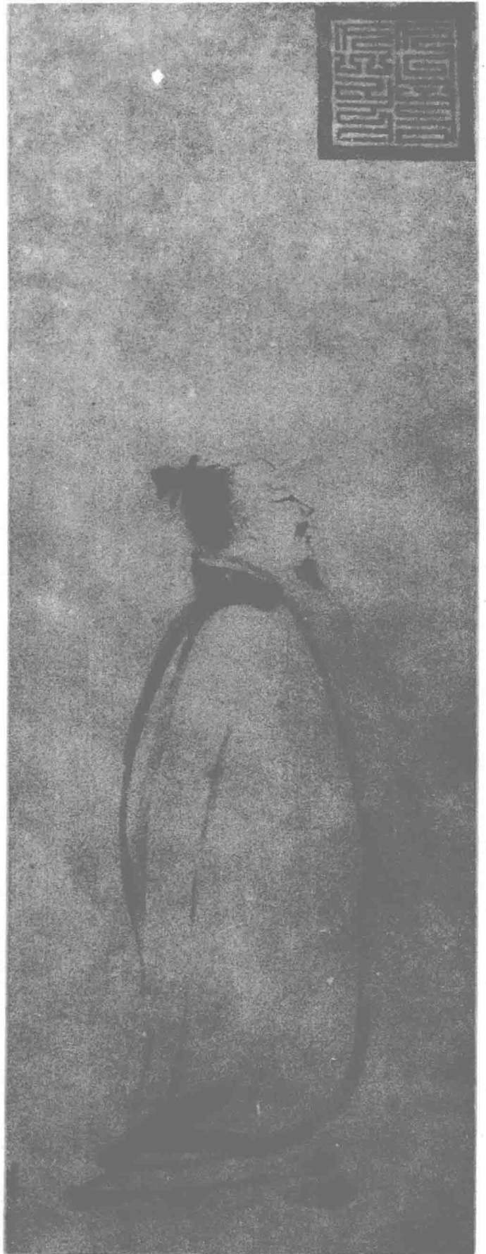
李白行吟图 (宋) 梁楷 作