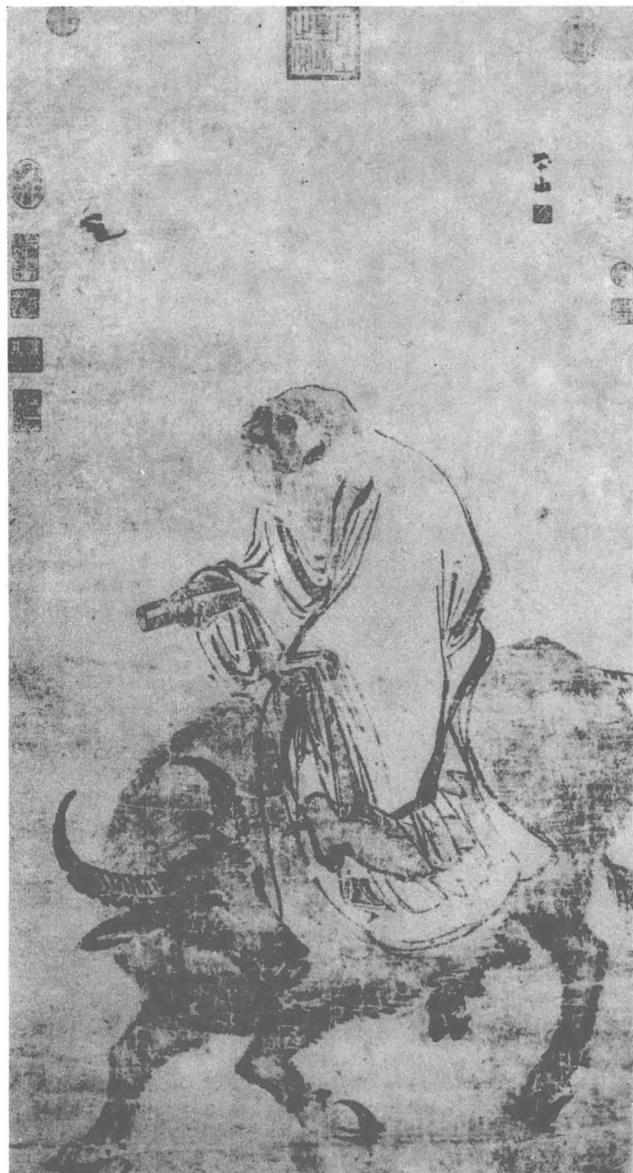
老子骑牛图 (明) 张路 作