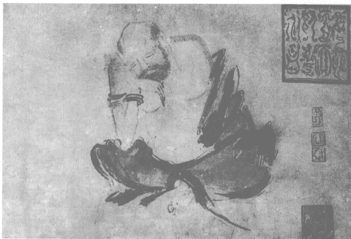
二祖调心图(局部)二幅 (五代) 石恪 作