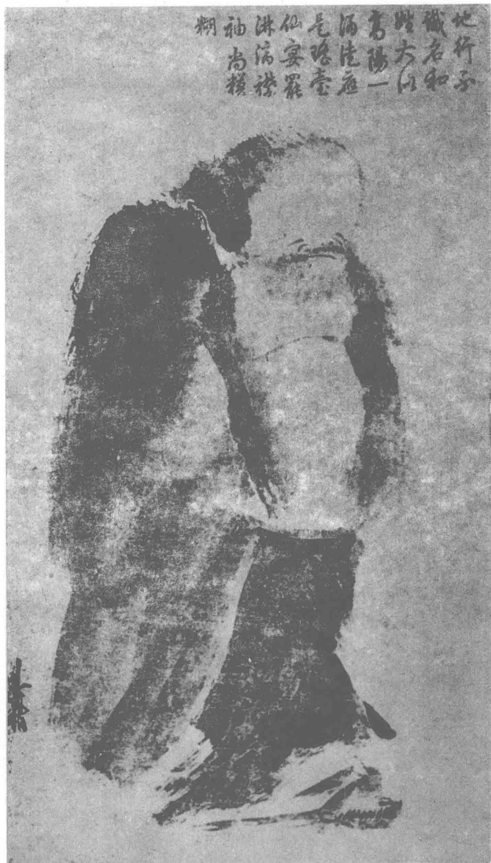
泼墨仙人图 (宋) 梁楷 作