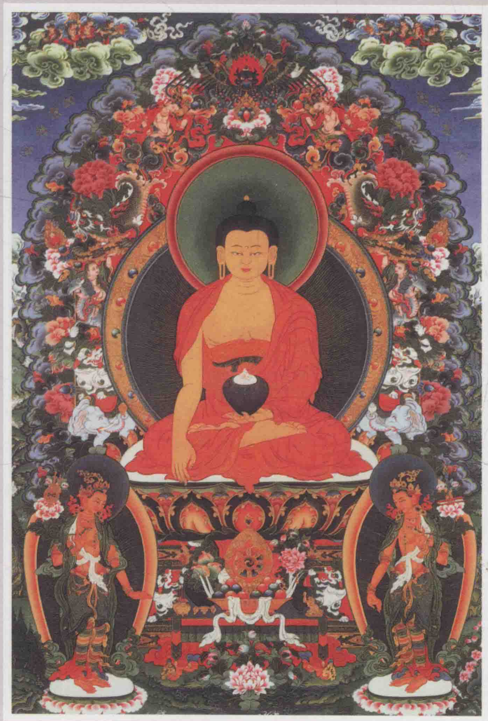
南无本师释迦牟尼佛