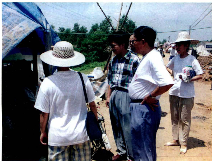
1998年8月中旬,随湖北作家群深入公安县分洪区,后写出小说《分洪前夜》。