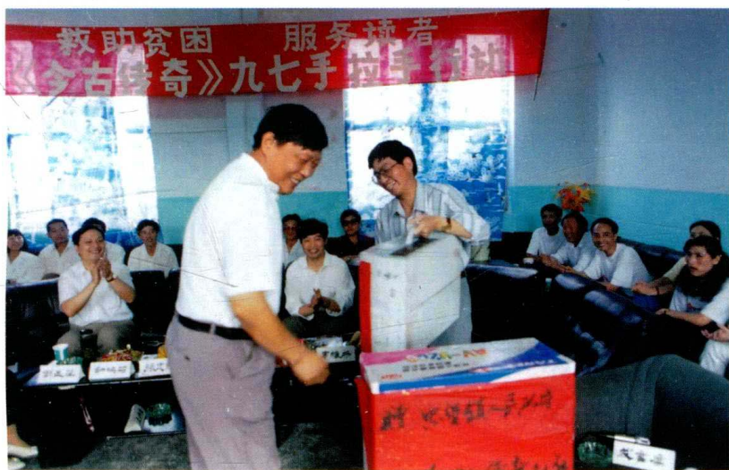
1997年夏,随《今古传奇》编辑部到恩施州咸丰县忠堡镇扶贫,并捐款。