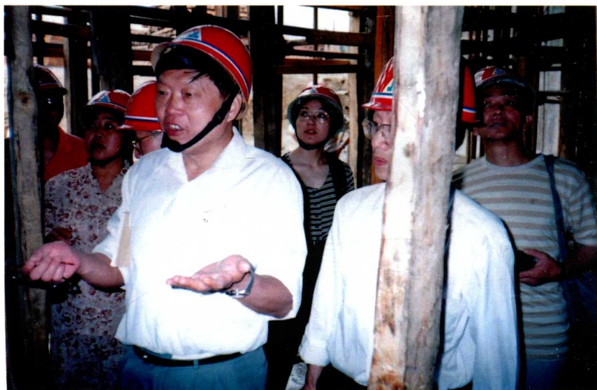
1996年6月，到中堡岛葛洲坝集团水利电力集团公司工地采访，后写出《刻在大坝上的名字》。