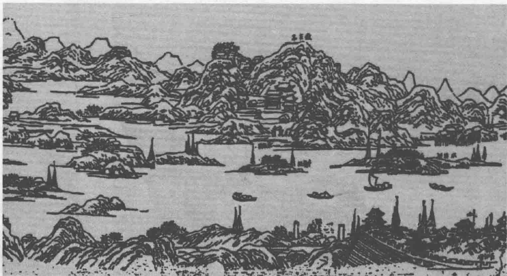
乾隆《南岳志》所载岳麓山全图（局部）

岳麓既为名山胜境，儒佛道三家遂争相进驻，构结营地，登坛讲说，培养传人。由此，自然风光而成人文景色。魏晋之时，万寿宫、崇真观皆为神仙福地；隋唐之际，麓山寺、道林寺称名释家丛林；两宋以来，岳麓书院号为天下四大书院之首。到如今，千百年文化浸润，仍然有迹可寻，云麓宫高居山顶，麓山寺盘踞半山，岳麓书院则静卧山麓，恰似入场顺序，诉说其文明进化的历程，以及儒释道三家的和谐交融。如果再加上禹王碑所代表的远古神话、先民传说，则谓岳麓一山实可缩写悠久而灿烂的中华文明，当不为过矣。