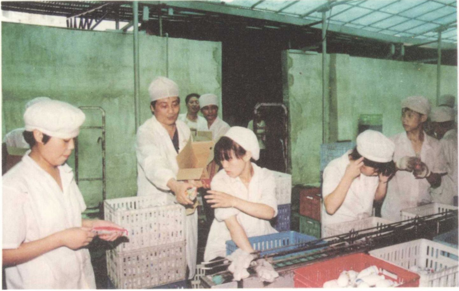
大热天的，宗厂长给员工们发冷饮解暑了。 ■