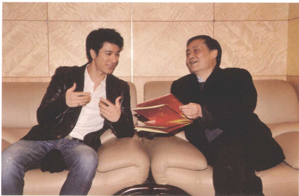
■ 宗庆后和娃哈哈的形象代言人王力宏是忘年交，他很欣赏这个帅小伙的阳光和谦逊。