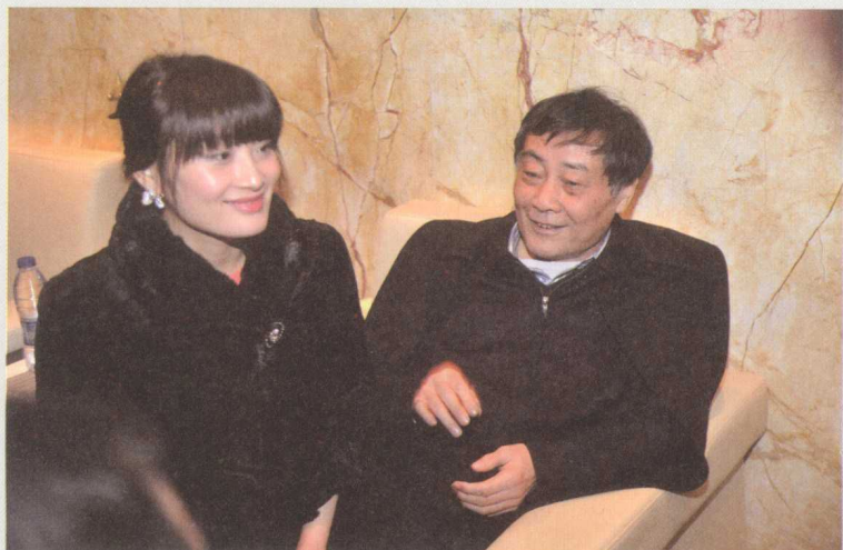
■ 2014年1月15日，宗庆后和女儿宗馥莉相遇在“风云浙商”颁奖晚会上。