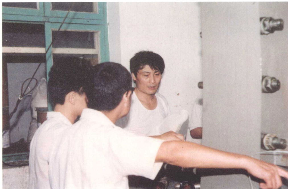
1989年，宗厂长在娃哈哈原液车间与工人们一起解决机器操作上的难题。