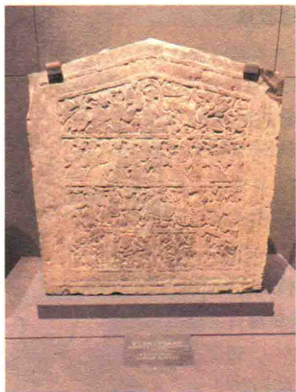
「东王父西王母汉画像石」