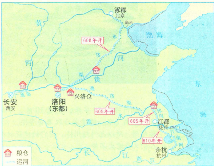
隋朝大运河示意图