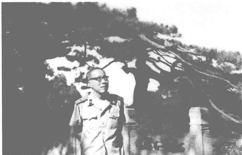
陈芳允在迎客松下

倡议者之一出现在电视屏幕和报端时，人们却觉得他是一个生面孔。其实他在国内外航天科技界已经很有名望了。而且，生活在今天的华夏子孙早已享受到他从事的航天科技结出的累累硕果。