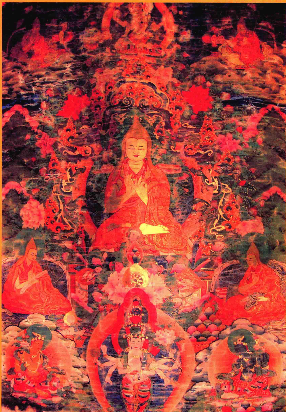
宗喀巴大师自画像（藏于民和回族土族自治县卡地卡哇寺）