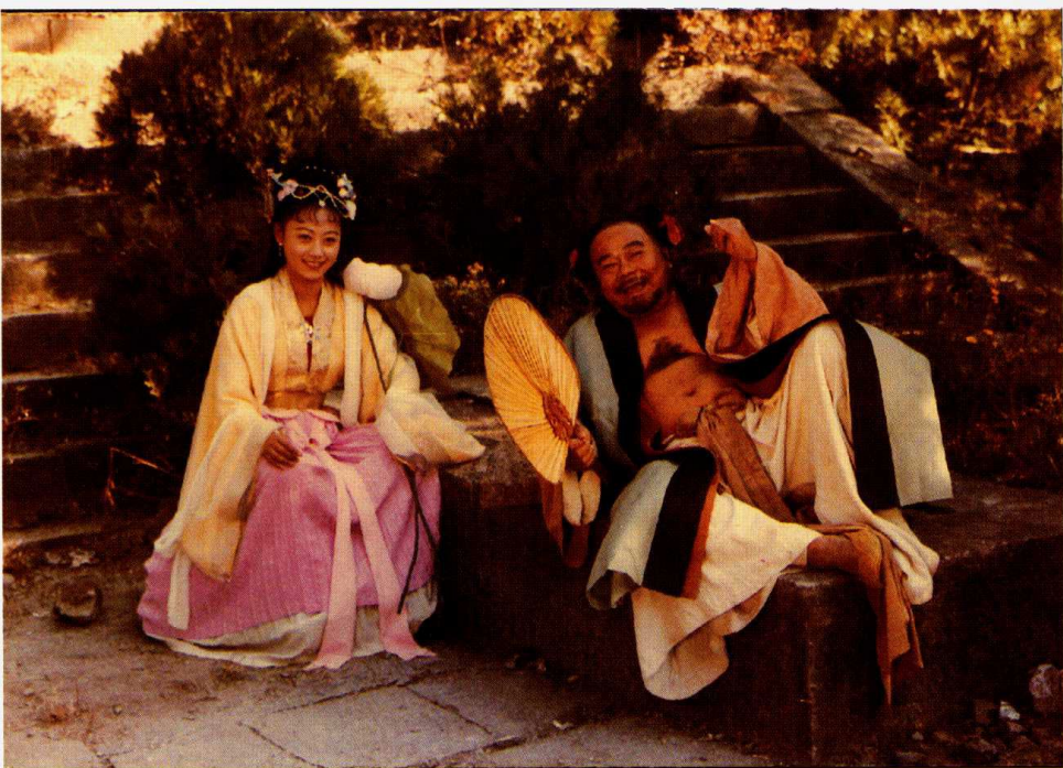
彩色故事片《八仙的传说》剧照之三