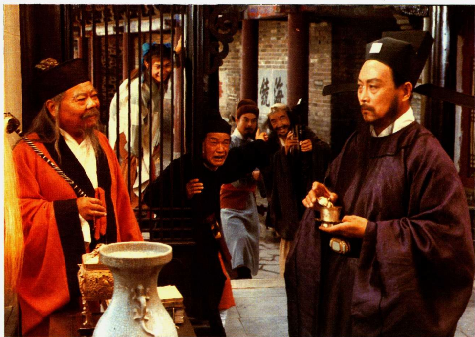
彩色故事片《八仙的传说》剧照之二