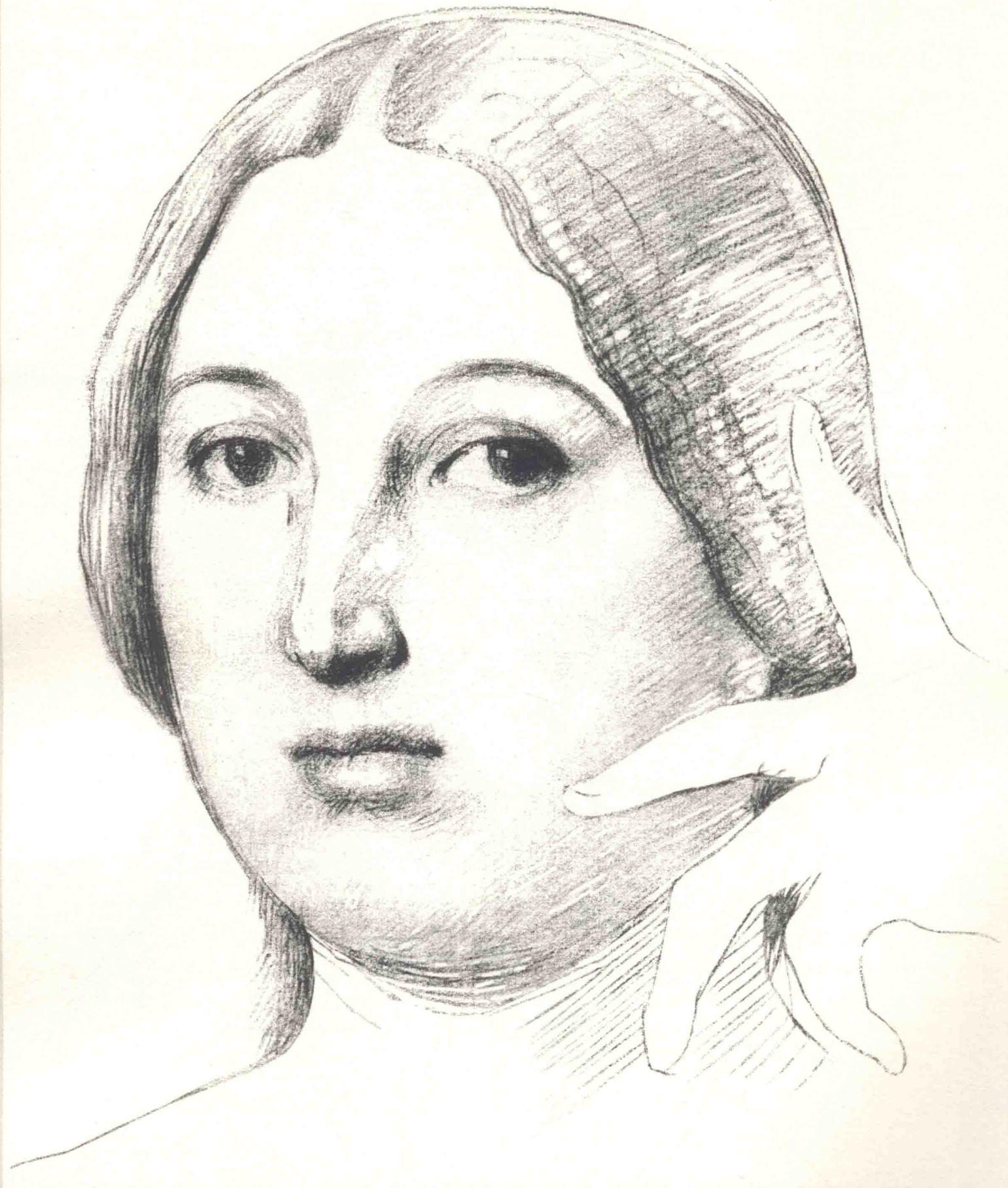
玛德琳·安格尔夫人